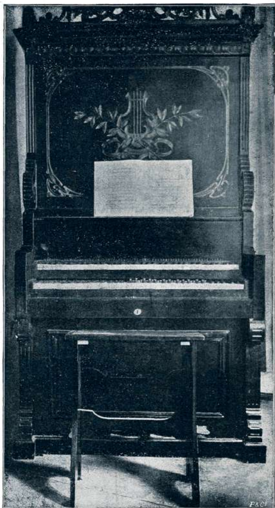
BAJDETOV KLAVIR NA LOK

doslej vedno le negativen, kajti jako težko je s pritiskom na tipko doseči tisti fini, nežnočutni glas, ki ga proizvaja lok na goslih. Klavir le udarja na strune, orglje imajo enakomeren glas piščali, težka naloga je pa združiti pri taki mehaniki elastični žimasti lok s poljubnim vzdrževanjem glasu. Gospod