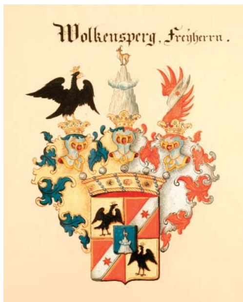
Grb baronov Wolkenspergov po letu 1753.