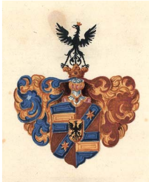
Grb družine Oblak - Wolkensperg, ki je bil v uporabi med letoma 1688 in 1753.

Wolkenspergi so bili povezani še z nekaterimi drugimi gospodstvi na Kranjskem, čeprav niso nikoli sodili med največje zemljiške posestnike. Poleg puštalskega gospodstva je bil od prve polovice 18. stoletja drugi center njihove