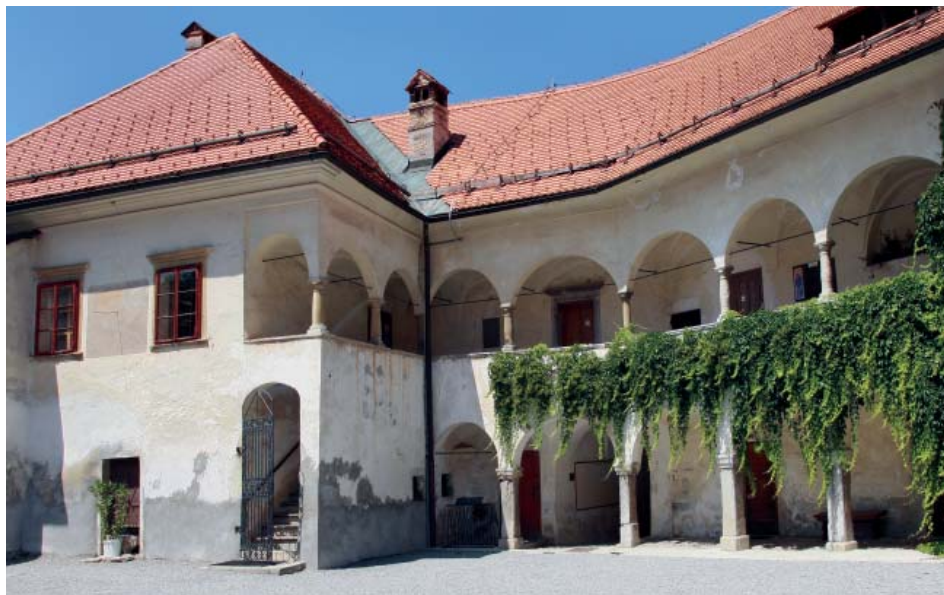
Dvoriščni del puštalske graščine, s poudarjenimi arkadnimi hodniki.