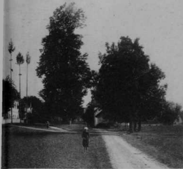
v. Ksista v Predosljih pri Kranju.