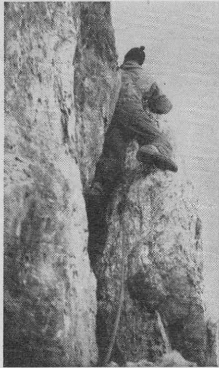
Vstop v raz Laserze