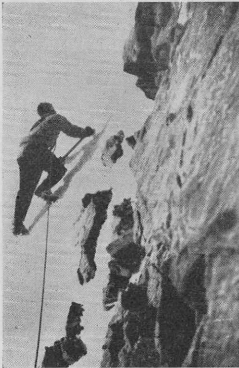
Tudi pod grebenom je precej strmo