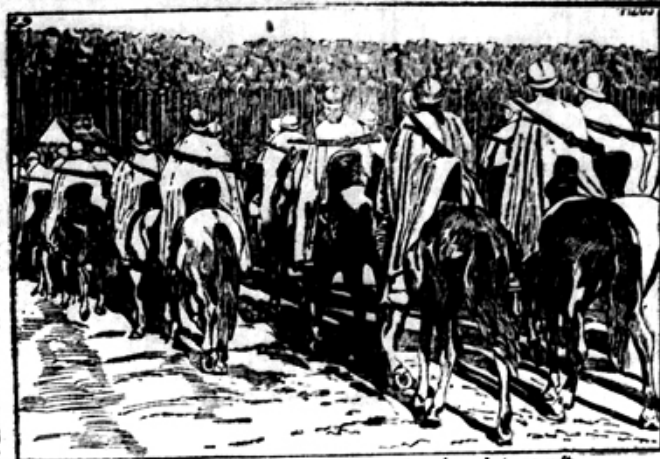
Französische Kavallerie in neuester Ausrüstung mit Stahlhelmen und Stahlsätteln.

Svoje nuspelbe so skušali Italijani zdaj s tem „izboljšati“, da so kakor afričanski dirjaki na nepostavni način zverinsko bojevanje, strljanje itd. vpeljali. Proti temu postopanju izdajalskih laških banditov je naša vlada zdaj nastopila. Izdala je poslanštvam zavezniških in neutralnih držav ostri protest. Ta protest se glasi glasom poročila c. kr. kor. urada tako-le: C. in kr. zunanje ministerstvo je moralo dne 22. marca t. l. pri akreditiranih zastopni-