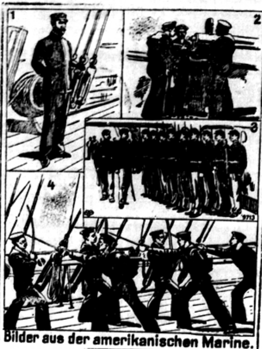
Bilder aus der amerikanischen Marine.

K.-B. Gästrow, 16. maja. „Güstrower Zeitung“ izve iz zanesljivega vira, se je name- raval v zadnjih dneh na švedskega kralja napad. Kralj bi se moral ob priliki nekega ogleda ko- njev v Djoregarden pri Stockholmu podati. Par dni preje dobila sta kralj in policijski minister svarila, ki sta se glasila, da naj kralj ne običje ogleda, ker je nameravan proti njegovemu ži- ljenju atentat, ki bi se imel ob priliki tega obika izvršiti. Posrečilo se je kralja od njegovega obika zadržati. Zudešo preiskajoče oblasti raz- krile so v resnici zaroto, ki je po dosedanjih podatkih od angleških in ruskih a- gentov pripravljeno dejanje. Izvršilo se je več aretacij. Pri zaroti udeleženi skušajo zdaj napad na roveč anarhistov spraviti. Ker šved- sko časopisje ne bi smelo o temu ničesar po- ročati in je le „Aftonbladet“ v par besedah za-