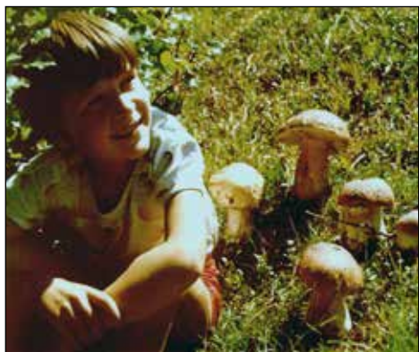
Slika iz mladosti.

Sodeloval si tudi v mali vokalni skupini, ki jo je vodil Sašo Zagoršek in je nastopala na različnih prireditvah. Pogosto ste kar sredi poka odšli na nastop; ste bili takrat zaradi tega "frajerji"?