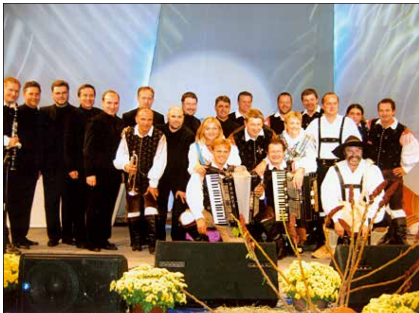
Na koncertu z ansamblom Gašperji.

Učimo se novih skladb, tako da smo v Prevaljah na Koroškem ob materinskem dnevu nastopili s polovico čisto novega programa. Ob klavirski spremljavi Urške Vidic smo peli skladbe, ki jih je pred 70 leti pela skupina Comedian Harmonists. Gre za barsko glasbo.