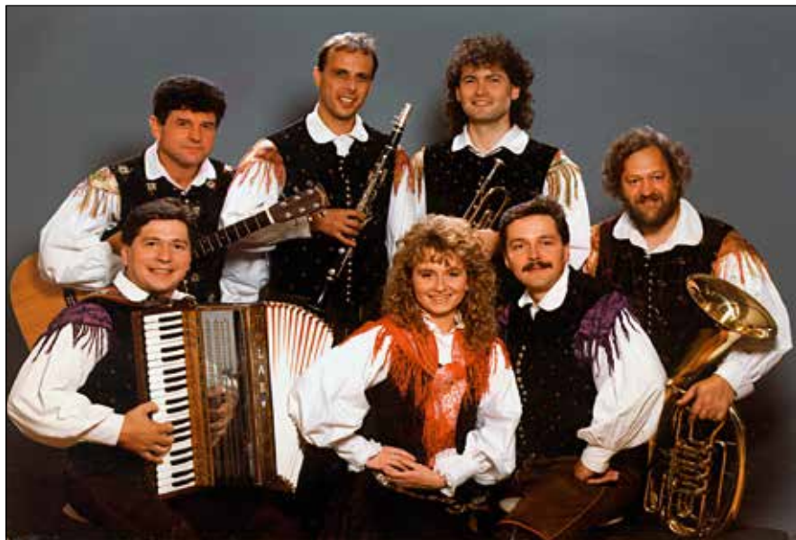
Ansambel Obzorje. Foto: Majhenič, Domžale