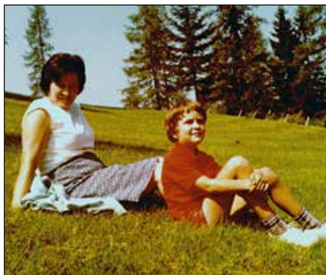
"Že od malega imam rad naravo."

Ne. Vsekakor je bil eden od nastopov nekaj čisto posebnega. Začel se je tako kot vedno. Na poti je učitelj Zagoršek na etiketo od Radenske prevedel in priredil besedilo znane pesmi o Titu, ki smo jo potem peli