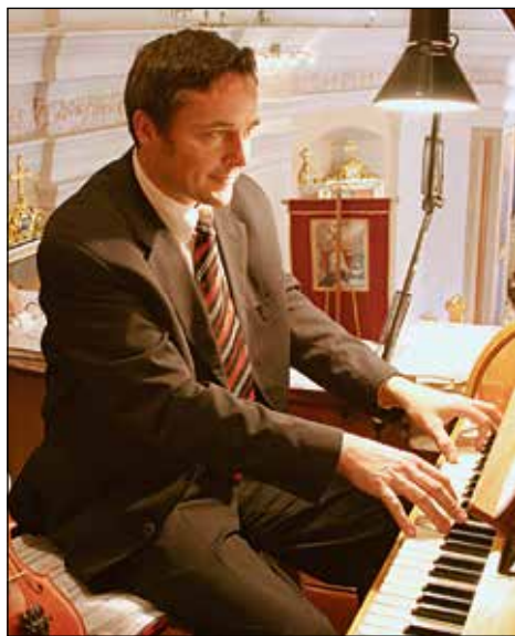
Na koru ob orglah.

mladinski pevski zbor, ob tem pa rad sprejemam tudi kakšne nove izzive. Trenutno sem združil sedem mladih glasbenikov v šolski ansambel z imenom Šolski muzikanti, ki igra narodnozabavno glasbo. Postali smo priljubljeni na naši šoli, pa še kje drugje. Otrokom take dejavnosti pomenijo izziv, saj je igranje timsko delo. Že na vajah se čuti, da so "res ta pravi muzikantje".