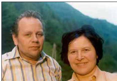
Starša.