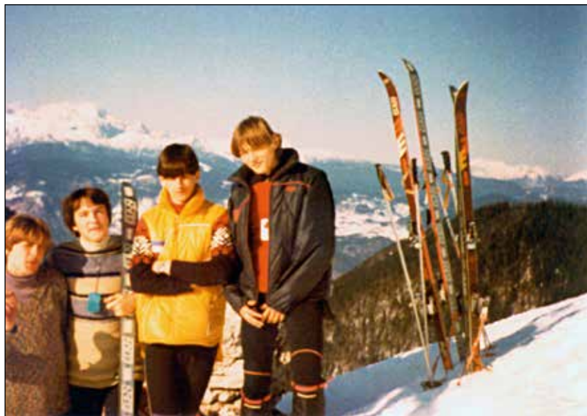
Prijatelji z Racovnika.