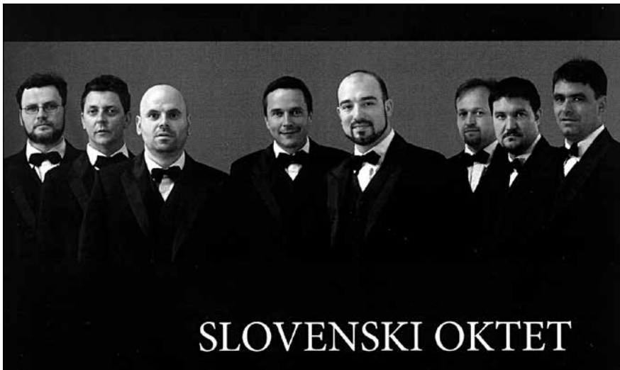
Slovenski oktet.

Naštel bom nekaj zame najbolj zanimivih nastopov