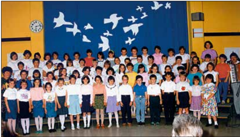
Na reviji otroških pevskih zborov.

li tudi skladbe, ki so nam bile vseč. Ko je on odšel, nam je bilo vsem zelo hudo, ker njegov naslednik ni bil tako predan poučevanju, čeprav o tem nismo nikoli želeli govoriti.