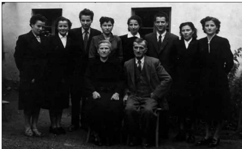
Lojzkova žlahta pred hišo v Grapi.

Nisem pa od starega očeta podedoval samo glasbenega talenta, ampak mi je dal tudi zgled, da se je z glasbo mogoče preživljati, saj se ob njej družijo veseli ljudje.