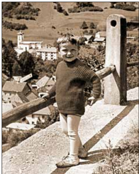
Moj rodni kraj, moj rodni dom.

oko, pesmica se je zgodila ..." (Zapoje.) Ne vem, zakaj sem pel ravno to. Najbrž je bila takrat popularna in od takrat sem na teh družinskih srečanjih vedno zapel kaj aktualnega.