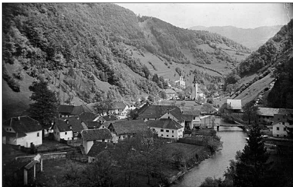
Naselje na Logu. Slikano z jugozahodnega dela Gorenjskega Kovaškega vrha.