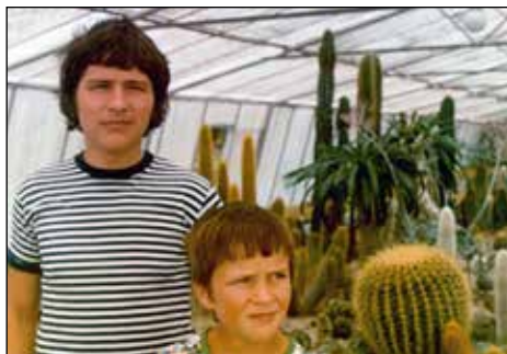
Z bratom Vanetom.