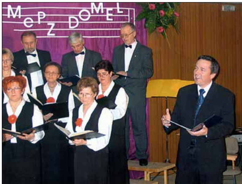
25-letnica MPZ DOMEL. Koncert v Železnikih.

Si tudi za Slovenski oktet некоč kar šel na avdicijo in so te sprejeli ali se tvoja zgodba oktetovca začne drugače? Kajti vedno ni dovolj, da si odličen, srčen in imaš znanje, ampak je izredno pomembno tudi, da si ob pravem času na pravem mestu. Kako je bilo?