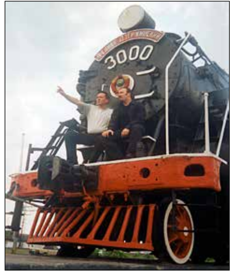
S transibirsko železnico na turnejo po Rusiji.

besede, da bi točno videl, vedel, kdo je pred teboj in kdo za teboj. Šele na nastopu smo ugotovili, da je pred nami, fizično in po programu, nastopil Rade Šerbedžija. Dva metra pred nami, vmes je bila zavesa, je ob kitari deklamiral Ne daj se, Ines. Dvorana je bila polna do zadnjega kotička in Šerbedžiji niso in niso nehali ploskati. In potem se je zastor pred nami dvignil, pravi gledališki zastor, da smo zapeli še mi: "Nocoj, pa oh, nocoj". Ljudje so jokali. Kajti bilo je