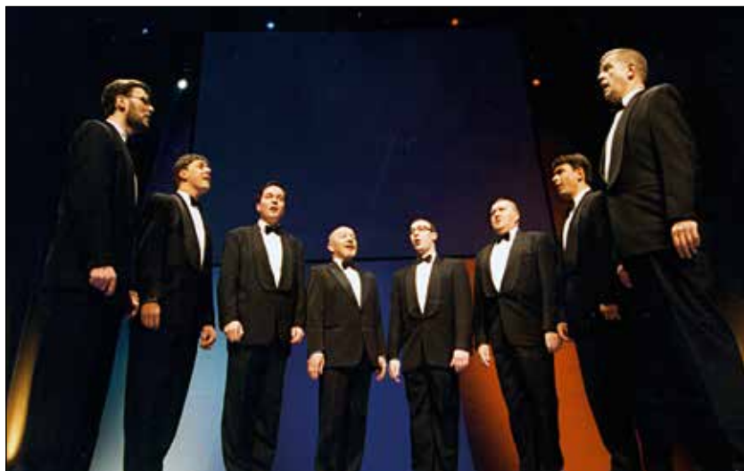
Slovenski oktet v novi zasedbi.

vem praznovanju, ki bo tako in tako zelo kratko, le od 21. do 24. ure. Ustregel sem jim, vendar pa sem zaključili šele ob 2. uri zjutraj in zunaj je snežilo. Bil sem neprespan, na avdiciji pa bi moral dati res vse od sebe. Ni mi ostalo drugega, kot da se opravičim in upam na najboljše. Jezen sem bil nase, še toliko bolj, ko sem slišal svoje konkurente. Vendar sem si rekel: "Naj bo, kot mi je namenjeno." Ker takrat niso nikogar izbrali, so v torek poklicali mene, naj pridem naslednjo soboto še enkrat na avdicijo. Takrat sem bil prepričan, da mi bo uspelo.