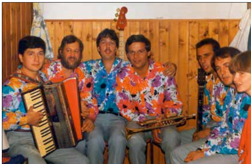
Ansambel Obzorje tik pred avdicijo za Ptujski festival "v rož'cah".

Za silvestrovanje v krogu družine sem bil prikrajšan kar nekaj let. Ko sem si ustvaril svojo družino, pa sem se odločil, da bomo te trenutke preživljali skupaj.