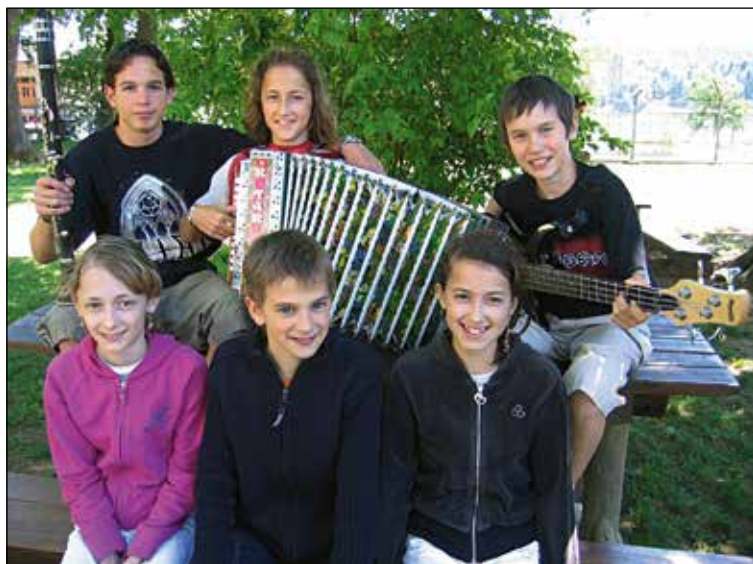
Šolski muzikantje.

Na prvem mestu je prav gotovo družina, trudim pa se, da bi vse moje življenjske naloge čim boljje uskladil in jih dobro opravil.