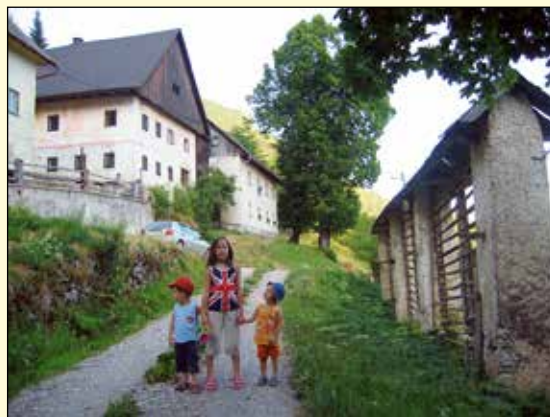
Zgornje Danje.