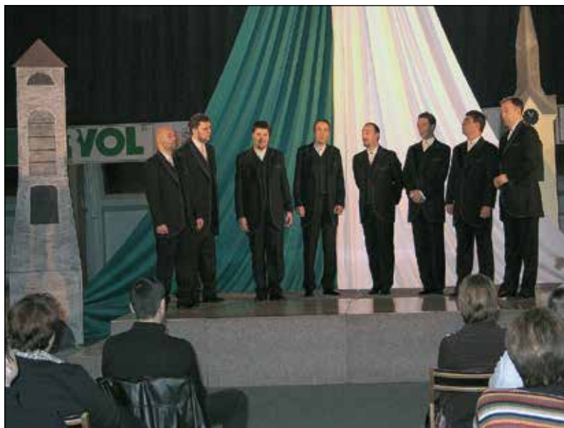
Koncert v športni dvorani v Železnikih, december 2005.