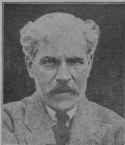
Macdonald, angleški min. predsednik.