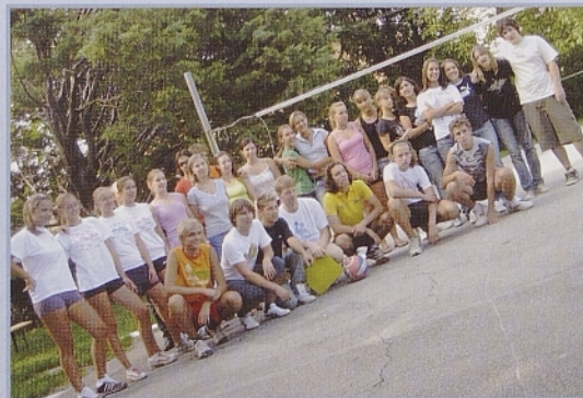
Plesna skupina »Light« na plesišču (zgoraj) in odbojarske ekipe na skupni sliki.

Publiki kar zastane dih, ko fantje iz novogoriške skupine »Go Breakers« izvajajo vrtoglave skoke, kot da bi bila to najbolj naravna stvar na svetu. Kmalu jih na plesišču zamenjajo prikupna dekleta domače plesne skupine »Light«. Tako – z glasbo, plesom in nasmejanimi obrazi – se je v poznem ponedeljkovem popoldnevu uradno začel 3. Festival mladinske ustvarjalnosti Draga mladih. Pred tem so se med splošnim smehom publike in igralcev v odbojki preizkusile štiri »improvizirane« ekipe. Izkupiček turnirja je šel v dobrodelne namene, udeleženci so namreč prispevali po evro za Misijonski krožek društva Rojanski Marijin