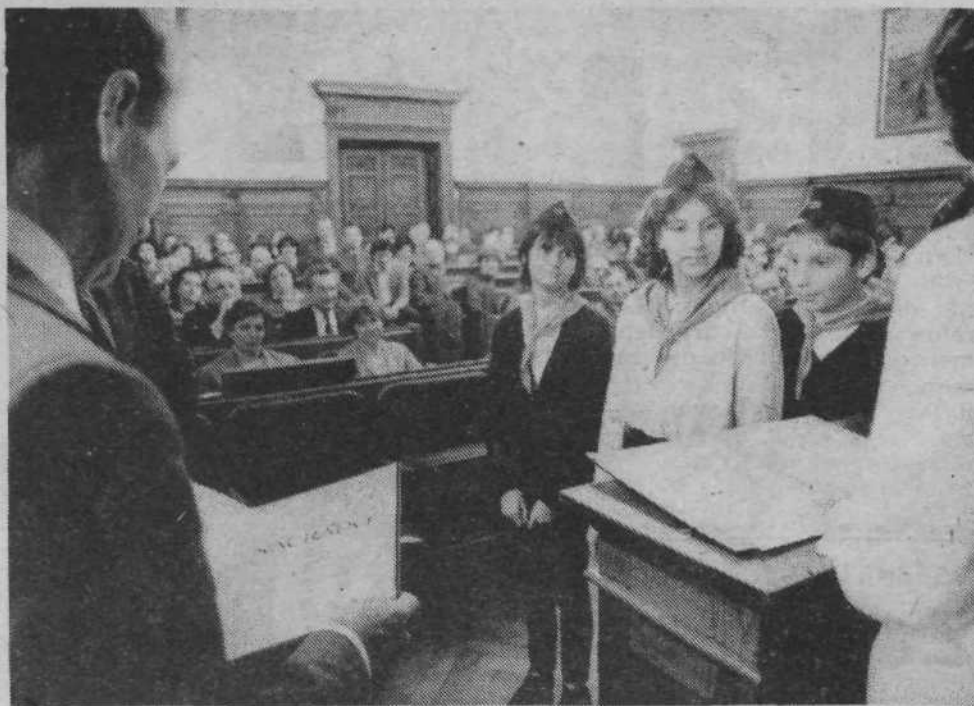
Letošnjo občinsko nagrado ob 9. maju so prejeli predstavniki občinske organizacije zveze pionirjev

Danes je položaj tak, da spet potrebujemo samozavest, takšno, kakršno smo imeli v letih 1941 in 1948, ko smo bili izpostavljeni najhujšim pritiskom. Pozabljamo, da smo imeli v tistih časih ne veliko več kot roke, danes pa imamo znanje in stroje. Dve leti že govorimo o gospodarski stabilizaciji, pa še niti za las nismo začeli ravnati drugače, kot smo vajeni. V naši občini skoraj ne poznamo delovne organizacije, ki bi v svojem programu napravila vsebinske spremembe. Imamo take, ki brez sramu načrtujejo izgubo. Vse prepočasi se uveljavlja spoznanje, da trgovina in industrija, kakršni imamo v Centru, zaposlujeta predvsem nizkokvalificirane delavce in da je v takih razmerah sila težaven prehod na proizvodnjo z visokim deležem vložene minulega dela. V naši občini moramo storiti veliko več za večjo produktiv-