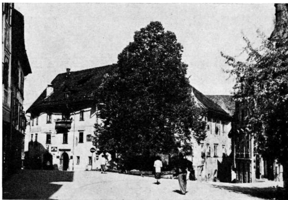
Sl. 2. Homanova hiša na Mestnem trgu — primer prostorske zapore

Na severovzhodni strani je prostorski značaj Lontrka vidno okrepila leta 1513 obnovljena kašča. Plošča, vzidana v njeno južno steno, omenja kot graditelja stavbe škofa Filipa, enega najbolj sposobnih freisinskih škofov. 4 Njegovim naporom za pozidavo Škofje Loke po potresu l. 1511 oziroma za utrditev mesta pred turško nevarnostjo, bi lahko pripisali poleg že omenjenih okrepljenih Poljanskih in Spodnjih mestnih vrat tudi zidavo stolpa, prislonjenega h kašči, ki ga srečamo na skoraj vseh starejših upodobitvah Škofje Loke od Meriana (1649), Valvasorja (1679, 1689), freisinske in sopotniške slike iz l. 1697 oziroma