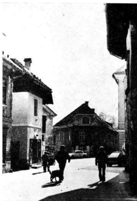
Sl. 4. Nekdanja Poljanska vrata na Mestnem trgu z novo prostorsko zaporo Karlovškega predmestja

1698. 6 Stolp je zaradi višine, ki presega vse okoliške stavbe, ena najbolj dominantnih točk loškega mestnega obzidja in obvladuje ves severovzhodni predel mesta, podobno kot Selška vrata predel pod gradom oziroma samostanom. Tudi ta vrata je škof Filip, da bi bolje zavaroval prehod čez kamniti most nad Soro, okrepil s trdnejšim stolpom, če smemo zopet soditi po naslikani plošči sopotniškega slikarja, ki je nameščena nad vhodom v stolp in spominja na plošči na Poljanskih in na Spodnjih vratih, o katerih smo zgoraj govorili.