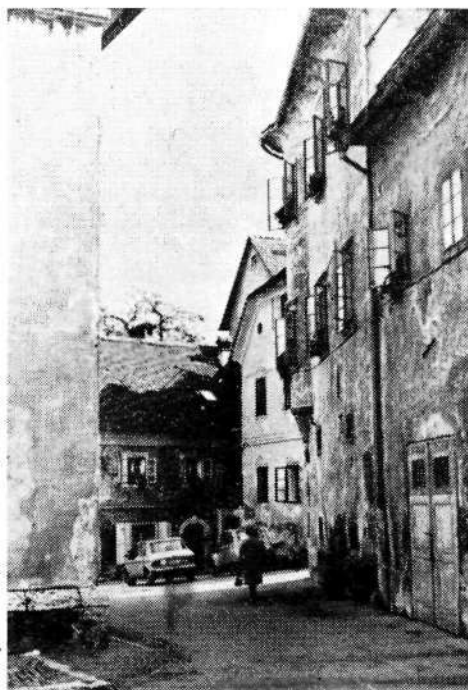
Sl. 8. Obrobje trga ob šentjakobski cerkvi