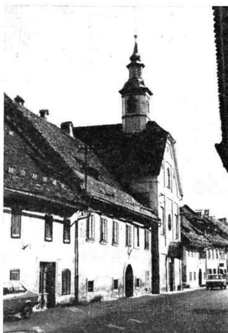
Sl. 9. Spitalska cerkev na Spodnjem trgu