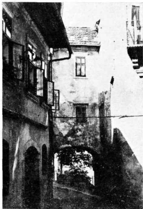
Sl. 5. Nekdanja Selška vrata s pogledom proti kapucinskemu mostu