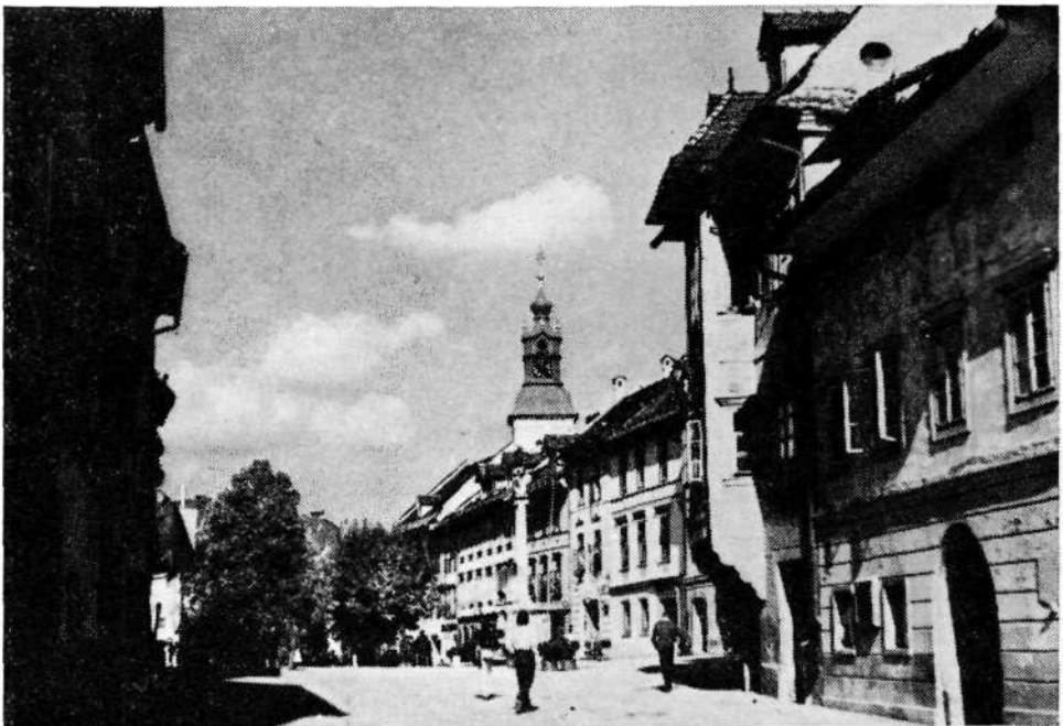
Sl. 1. Mestni trg z baročnim znamenjem, v ozadju zvonik šentjakobske cerkve

V 16. in 17. stoletju se prostorski značaj škofjeloških mestnih ambientov okrepi, predvsem zaradi preoblikovanja fasadnih ploskev meščanskih hiš, ki se s svojo širšo stranjo obrnejo proti cesti in tako zapolnijo prehode, ki so nekdanj ločevali posamezne stavbe med seboj. Prostorska dognanost loškega Mestnega trga pa zraste še posebej zaradi razvoja meščanskih hiš v vertikalni smeri. Namesto enonadstropnosti prevlada dvonadstropnost. Nekdanj gladke površine fasad dobivajo plastičen okras v obliki nadstropnih pomolov, ogelnih stolpičev itd., ki segajo v prostor trga in zavirajo njegovo gibanje. Prostor ne uhaja več