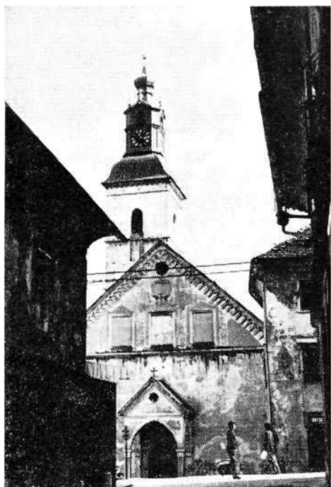
Sl. 7. Cerkev sv. Jakoba iz Blaževe ulice

Zidava zvonika šentjakobske cerkve leta 1532 ni samo obogatila vedutno kompozicijo Škofje Loke, temveč je močno vplivala tudi na dognanost njenih prostorskih ambientov. Vpliv zvonikove dominante se je raztegnil čez ves jugozahodni predel Mestnega trga, segel čez Kadivčevo hišo na Lontrk, prostorsko zajel vzhodni iztek Blaževe ulice in še posebej prehod, ki vodi z Mestnega trga mimo Homanove hiše h Kadivcu. Tudi prostorska scena Mestnega trga je bila prav po zaslugi renesančnega zvonika znatno obogatena. Na njegovo vertikalo so se navezovale tudi vedno manj pomembne navpičnice, npr. strešna stolpiča Mestne hiše in kapele sv. Trojice. Stik z zvonikovo gmoto iščeta tudi baročno Marijino znamenje in kamniti vodnjak iz l. 1833. Samostan klaris, 15 stisnjen ob severozahodno pobočje grajskega hriba, ni imel pri oblikovanju loških ambientov pomembnejše vloge. Izvzeti sta Blaževa ulica ob vstopu v mesto, katere prostor dominantno zaključuje baročna fasada nunske cerkve, in ozka Klobovsova ulica ob vznožju grajskega hriba, ki teče vzporedno z Mestnim trgom in jo na severni strani s svojim širokim arhitekturnim telesom skuša zapreti poslopje samostana.