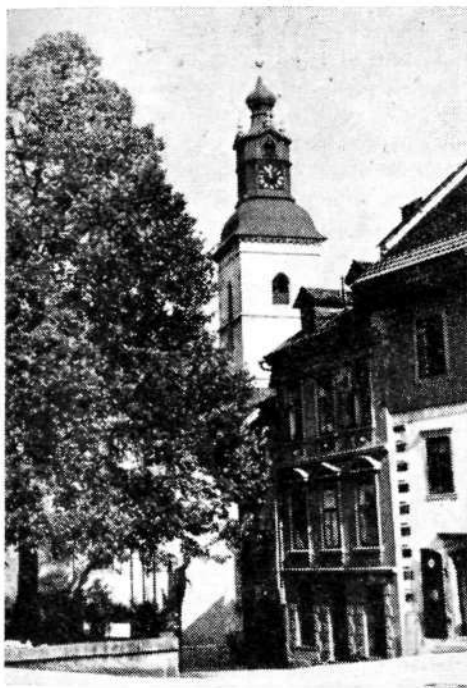
Sl. 3. Zvonik šentjakobske cerkve in njen vpliv na prostorsko izoblikovanje severovzhodnega dela Mestnega trga