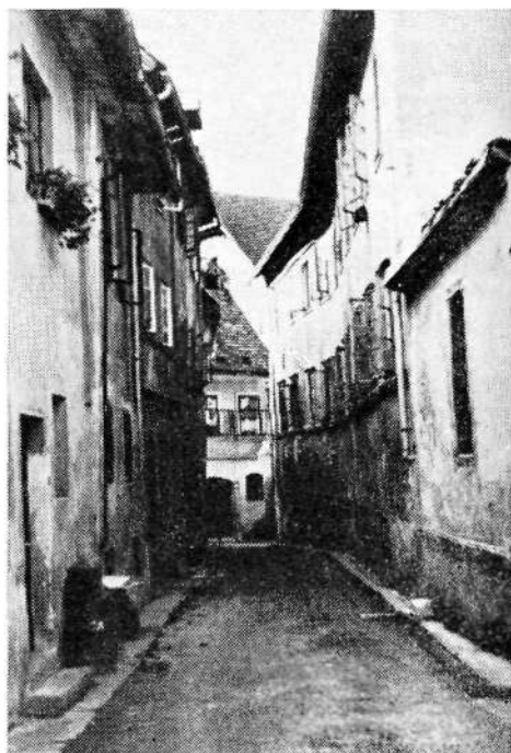
Sl. 6. Primer prostorsko izoblikovane ulice (nekdanja Rožna ulica)