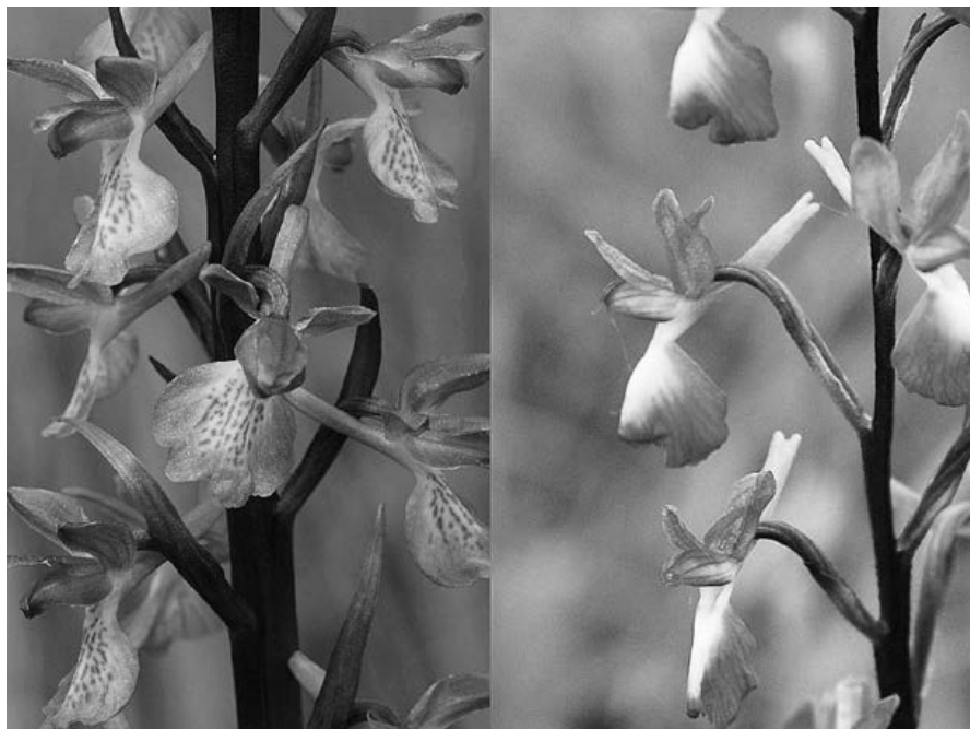
Slika 2: Levo: močviriska kukavica ( O. palustris ) z Grobiških mlak pri Rakitniku; desno: rahlocvetna kukavica ( O. laxiflora ) z Belega Kamna pri Kubedu

Figure 2: Left: O. palustris - Grobiške mlake at Rakitnik; right: O. laxiflora - Beli Kamen at Kubed