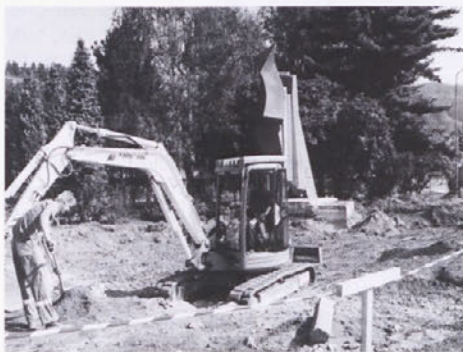
Tako so zakopali stroji

Tam nekje junija lanskega leta so delavci cestnega podjetja iz Maribora pričeli z zemeljskimi deli priprave za sanacijo ozkega prometnega grla Koroške ceste ob spodnjem vходу Železarnе.