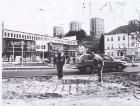
In tako so zapeljali čez križišče potem

Seveda je vsa dela otežkočal vsakdanji gost promet po gradbišču Koroške ceste, svoje so pridali tudi ravenski vozniki osebnih avtomobilov, ki so se neradi posluževali obvoznice skozi Trg svobode in naprej po Malgajevi ulici. Pa je prihajalo tudi do ostrih besed zaradi parkirnih prostorov, saj je bil tisti pri spodnjem vratarju Železarnе zapolnjen z cestno mehanizacijo in gradbenim