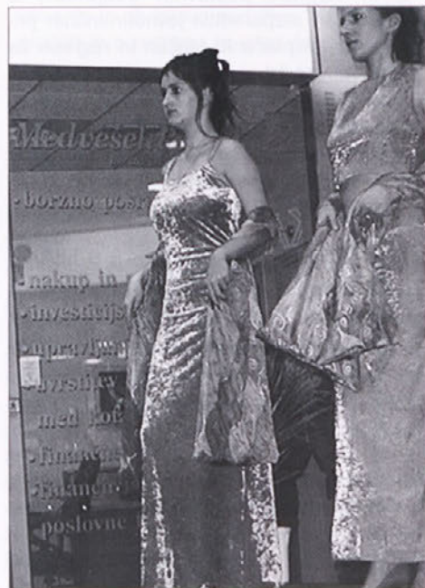
iz kolekcije svečanih oblačil