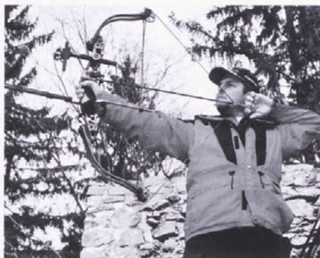
Ko pojejo titive

Sicer pa so tokrat izjemno streljali Ravenčani, ki se jih drži tudi sloves odličnih organizatorjev. Prvič so bili 28. decembra 2002 na tekmovanju Dravograjčani, organizirani kot klub. Torej imamo v Dravogradu registriran novi lokostrelski klub in ker vemo, da je tu doma kar nekaj odličnih strel-