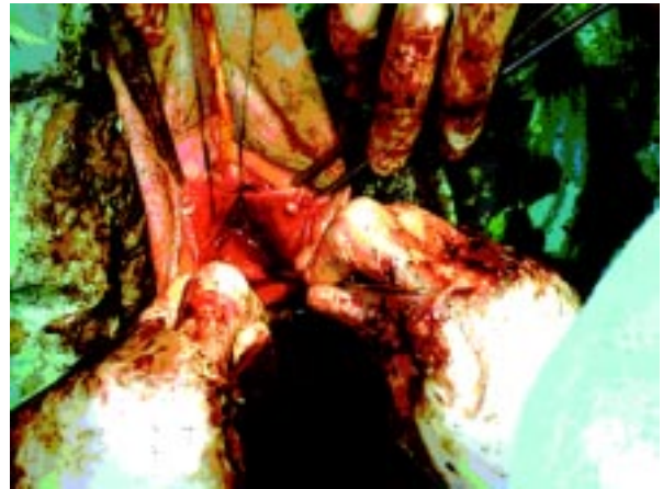
Sl. 1. Prerektalna loža s sidrnimi šivi, stanje po opravljeni rektorafiji.

Ker je operacija nova, imamo za vse operiranke le rezultate pregleda, ki smo ga opravili 5 do 7 tednov po operaciji (tab. 1).