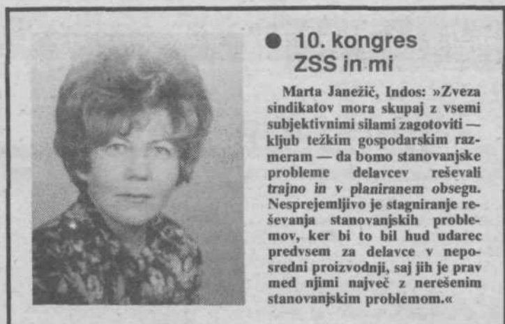
● 10. kongres ZSS in mi

Vključitev Jate v sozd Hmezad je prekinila nekatere dileme, ki so ponujale vertikalno povezavo v samem perutninarstvu, pa tudi tiste, ki so dajale »predpravo« lokalnim težnjam. Proizvodna osnova kot prvi vir dohodka in obstanka je odtehtala odločitve za Hmezad. M. M.