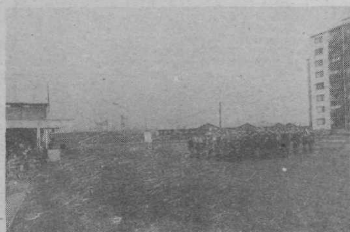
Na prostoru, kjer bo stal prizidek k OŠ Jožeta Moškriča, je pred položitvijo temeljnega kamna igrala godba milice