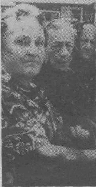
V delu je mladost: priznanja za najstarejše