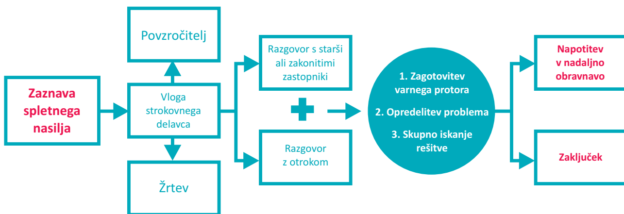
Slika: Shematski prikaz obravnave na CSD

Ločeno ali skupaj bo potekala tudi obravnava z otrokovimi starši. Staršem bo strokovni delavec nudil pomoč pri reševanju vzgojnih vprašanj, postavljanju mej, strukture dneva mladostnika in jih po potrebi tudi napotil v zunanje institucije, ki nudijo pomoč pri reševanju stisk, s katerimi se soočajo. Družino bo obravnaval celostno, raziskal, kje družina potrebuje pomoč, zato se ne bo osredotočal samo na kaznivo dejanje ali prekršek, temveč tudi na siceršnje razmere v družini (npr. finančno stanje družine, odnosi v družini, morebitne odvisnosti v družini itd.).