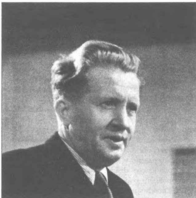
Miha Marinko (1900-1983), dolgoletni voditelj slovenske Partije 1946-1966, od leta 1953 predsednik SZDLS, predsednik slovenske vlade od 1946 do 1953, predsednik Ljudske skupščine LRS od 1953 do 1962, republiški in zvezni poslanec, od leta 1958 tudi član Izvršnega komiteja CK ZKJ.

Josip Broz in organizacijski sekretar Aleksander Ranković, demokratizaciji pa so bili bolj naklonjeni Milovan Djilas ter politično previdnejša Vladimir Bakarić in Edvard Kardelj. Precej "konzervativcev" je bilo v republiških partijskih vodstvih, zlasti v srbskem in črnogorskem. Tudi v slovenskem izvršnem komiteju, ki ga je vodil po Djilasovi oceni konzervativni Miha Marinko, vidnejših zagovornikov demokratizacije ni bilo, čeprav sta bila med njegovimi člani kasnejša reformista Boris Kraigher in Stane Kavčič.