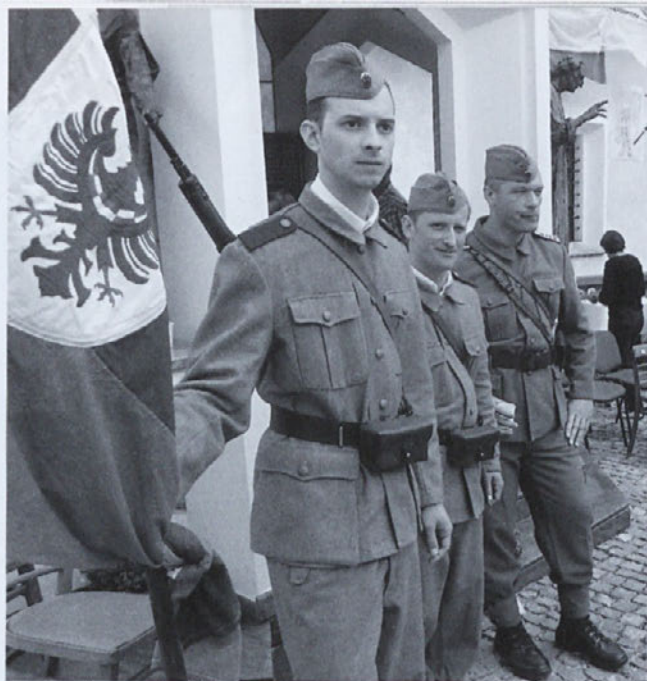
Ponosni domobranci v Šentjoštu