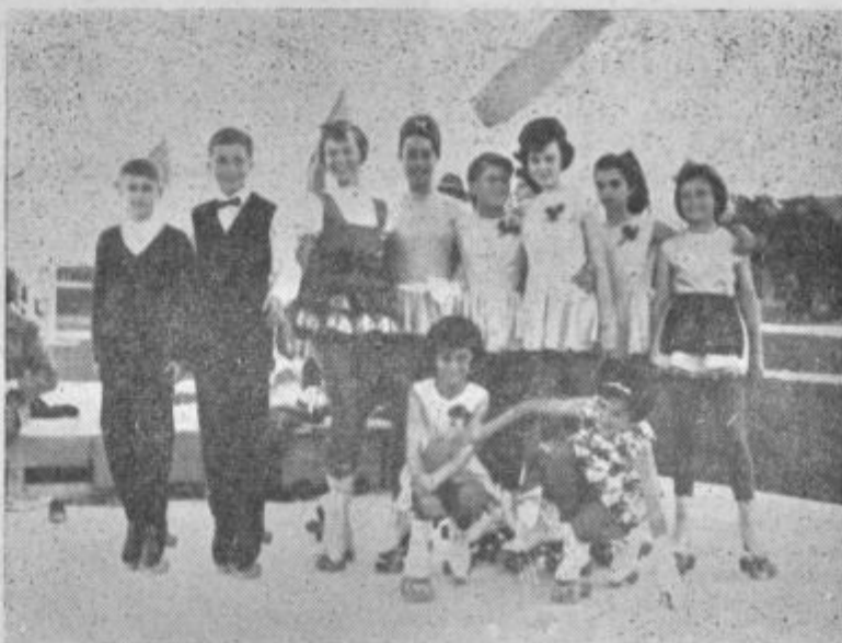
Velenjski kotalkarji so v zadnjih treh mesecih izredno napredovali in letošnja pomlad ter poletje sta jih že vpeljala v uspele revijske nastope. Posnetek kaže srečo mladih ob prvem javnem nastopu.