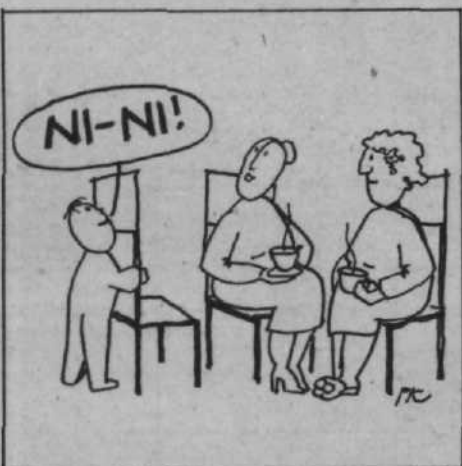
Včeraj je šel z mano po nakupih, pa se je naučil...