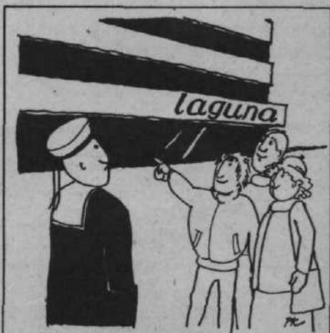
Vidiš, očka, tukaj smo pa mi zasidrani!

Če računamo, da je v enem stopnišču 51 stanovanj, da je devet nadstropij, ugotovimo, (če je kvadratni meter 16.315 dinarjev), da mora vsak stanovalec samo za to projektantsko napako plačati okoli 30 tisočakov. In koliko stanejo še železne stopnice, pa železna vrata in delo, pa sprememba projekta? Najbrž še enkrat toliko! Kriv pa seveda ni nihče! Če bi kdo bil, potem kupci ne bi plačevali napak, ampak tisti ki so jih zakriviliiii!