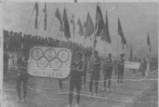
Mimohod ekip na letošnjih športnih igrah gradbincev

1.880 tekmovalcev in tekmovalk iz 50 slovenskih podjetij gradbene stroke se je pomerilo v 7 športnih panogah - malem nogometu, odbojki, namiznem tenisu, kegljanju, balinanju, streljanju in šahu. Čeprav so tovrstna sindikalna tekmovanja v zasnovi rekreacijskega značaja, nastopajočim ni manjkalo tekmovalnega duha. Stari Coubertinov rek „Važno je sodelovati!“ kot da je tokrat izgubil na veljavi. Boji so bili neizpros-