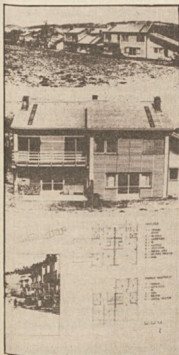
Tipičen primer gradnje naselja na Predarlskem.