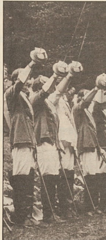
S sabljami nad mir!

„Vom Tal bis an die Gletscherwand, tön deutsches Lied im Kärntnerland“, je ob oltarju pel moški zbor in tako potrdil programatično smer te prireditve. Pod oltarjem so v dolgi vrsti strumno stali, oboroženi z meči in čez ramena trakove v nemških barvah, zastopniki nemškonacionalnih in katoliških študentov.