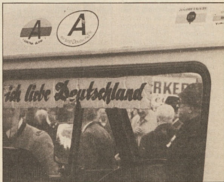
Impresija z Vrha: očitno potrdilo ozadij srečanja (poročilo o nedeljski proslavi ulrichsberške družine berete na str. 2/3.)

Solidarnostno pismo je poslala tudi Srednja naravoslovno matematična in kovinarsko-strojna šola iz Postojne: „Od avstrijske vlade zahtevamo, naj spoštuje določbe državne pogodbe iz leta 1955“, nadalje je v pismu rečeno, naj dvojezično šolsko ureditev velja na celotnem dvojezičnem področju, kot je bilo sprejeto leta 1945.