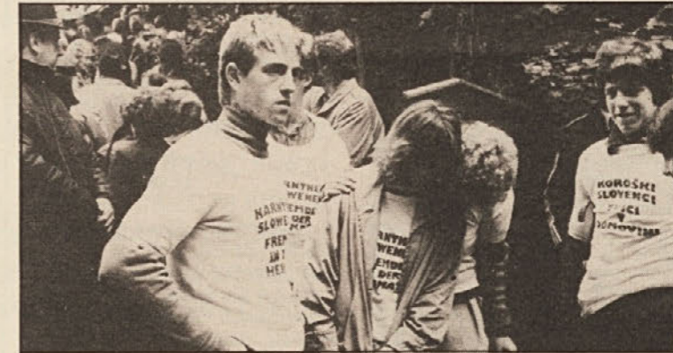
Miren protest KDZ proti narodni mržnji.

Kdor je iskal na Vrhu mirovno manifestacijo, se je prepričal, da so si proponenti te manifestacije odeli plašček miroljubnosti in sprave. Ampak v deželi poznamo njihova dejanja in njihova manifestacija je bila samo krinka.