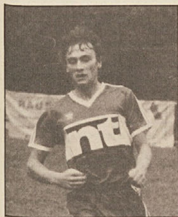
Že drugič je odločil tekmo za Selane Nanti Travnik.

Po zmagi proti celovškemu klubu KAC, so Selani pretekli konec tedna pričakovali večje število gledalcev proti ATSV Wolfsberg. Toda deževno vreme ter nastop Laude na televiziji sta tokrat veliko prijateljev nogometa obdržala doma. Selani so kljub slabi igri v drugi polovici premagali sovratnike iz Wolfsberga z 1:0 in s tem ponovno pokazali, da so s svojim ofenzivnim načinom igre obogatitev za podligo.