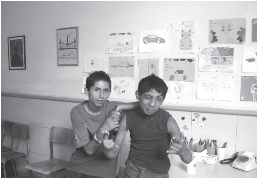
Slika 7: Učenci in njihovi likovni izdelki