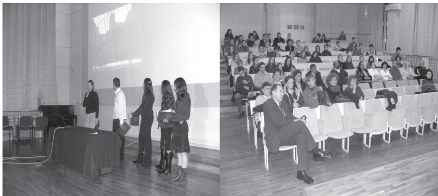
Slika 3: Predstavitev Odprte učilnice

Tukaj se končuje drugi del zgodbe o Odprti učilnici in se začenja tretji, ki govori o ustanavljanju prostovoljnega centra, ki smo ga poimenovali Društvo za pomoč otrokom pri učenju.