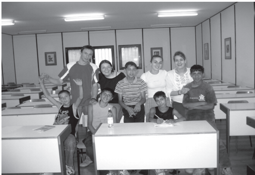
Slika 2: Bodoči učitelji in njihovi prvi učenci v novi učilnici

V začetku septembra 2005 sem vzpostavila stik z ravnateljem Osnovne šole Branko Pešić. Ta osnovna šola je posebna v tem, da vpisuje otroke, ki so že “prerasli” prvi razred (zamudili z vključevanjem v redno šolanje s 7 leti). 1 To so praviloma romski otroci, otroci izseljencev iz Kosova, otroci deportiranih Romov iz zahodnih evropskih držav, otroci, ki so v svojih šolah večkrat ponavljali razred ali so izključeni iz svoje šole. Program pouka se prilagaja potrebam učencev, še posebej so pozorni na materni jezik in predhodno šolanje.