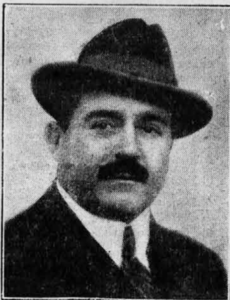
Ministrski predsednik Živković

obrt. Strokovno znanje se dokaže s spričevalom o položenem pomočniškem in mojstrskem izpitu ali z izpričevali o izvršenih izpitih strokovnih šol, ki jih bo minister trgovine in industrije označil na temelju § 26. zakona. Kdor dokaže to strokovno znanje ozir. izobrazbo in dobi v smislu zakona pravico za izvrševanje obrta, ta ima pravico do naslova »mojster«. Nikomur se ne dovoljuje izvrševati obrtov, kdor ni predložil dokazov o strokovni usposobljenosti za dotični obrt. So pa izjemna določila, ki tudi drugače dovoljujejo izvrševati obrt; to pa le