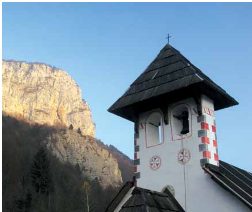
Zvonik cerkvice sv. Egidija v Ribjeku z Loško steno v ozadju.