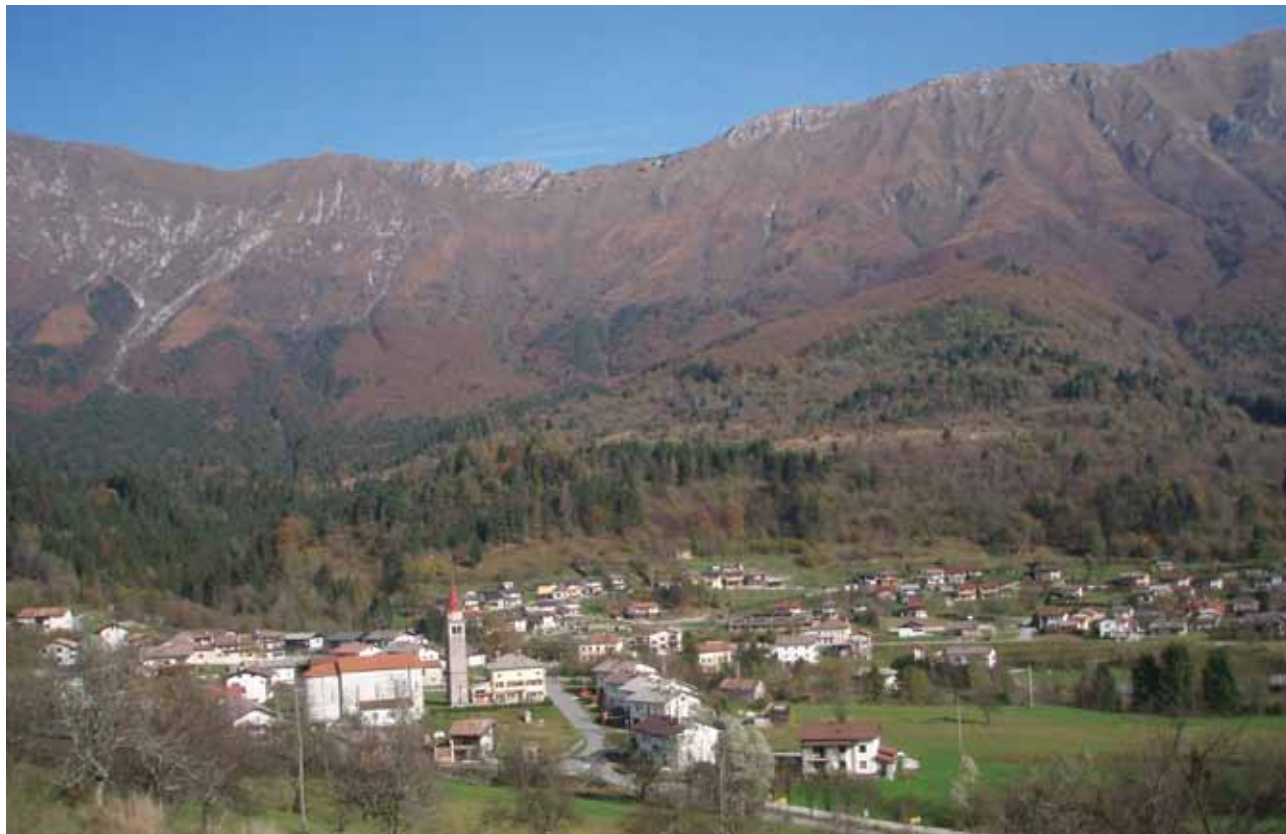
Pogled na Breginj, v ozadju pogorje Stola.

muzej. Sledila je vožnja po dolini reke Tilment proti zahodu. Iz kraja Ampezzo smo zapeljali v sotesko reke Lumiei, ki je v najožjem delu pregrajena za potrebe hidroelektrarne. Za jezom, ki je v času gradnje veljal za enega najvišjih v Evropi, se razprostira umetno jezero. Nad njim smo obiskali Sauris/Zahre, najvišje ležeče naselje v deželi. Tu živijo prebivalci, ki še vedno govorijo arhaično nemško narečje, saj so se prvi naseljenci priselili sem s Tirolske in Koroške že v 14. stoletju. Iz Saurisa smo se vrnili v dolino Tilmenta in pot nadaljevali ob reki Degano proti severu. Zavili smo v stransko dolino Pesarina, ki slovi po čudovitih gorah (Pesarinski Dolomiti) in bogati tradiciji izdelovanja ur. Posebej zanimiva je urarska učna pot po vasi Pesariis, ob kateri so postavili deset najrazličnejših modelov velikih ur. Zanimiv je bil tudi postanek ob poševnem