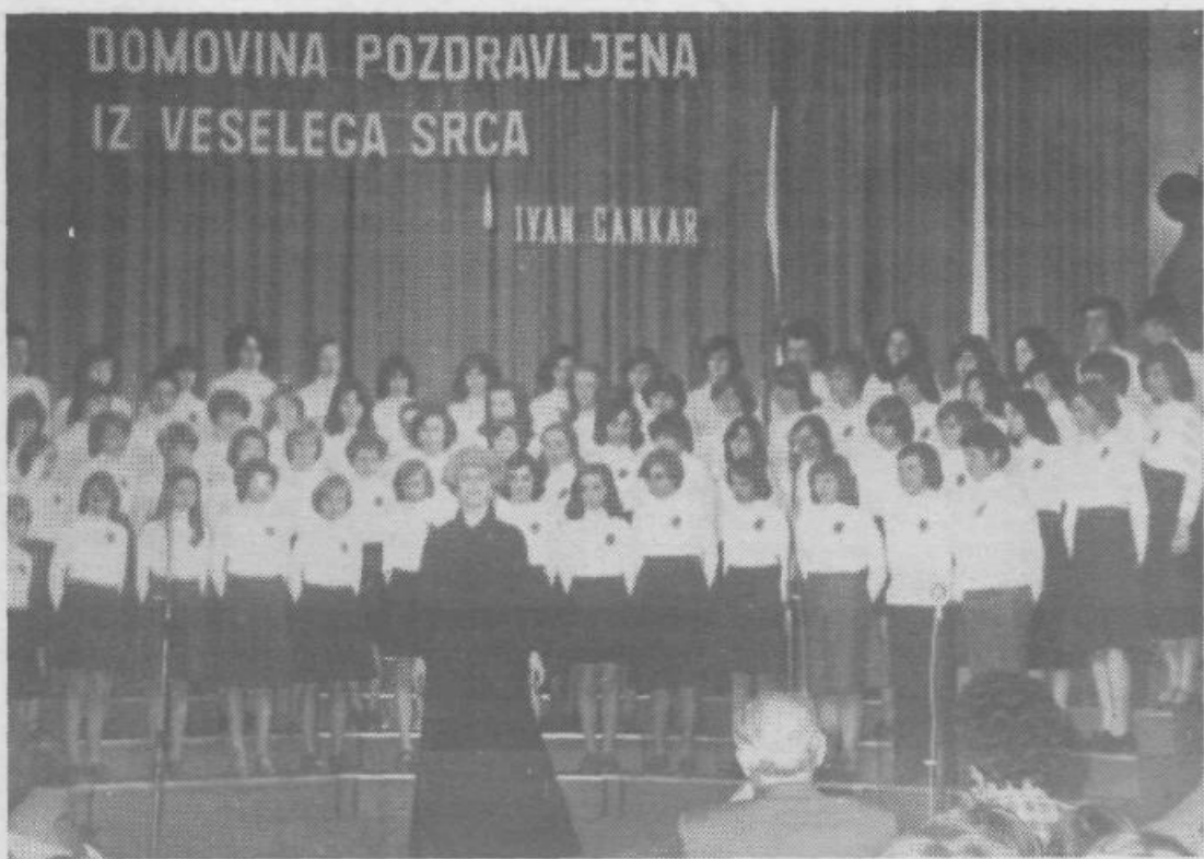
PEVSKA REVIIJA POSVEČENA I. CANKARJU

Člani kluba zdravljenih alkoholikov se zahvaljujejo kolektivu Papirnice Vevče za brezplačno uporabo dvorane kulturnega doma in kolektivu TOZD Mesna industrija Zalog za pokroviteljstvo nad letno skupščino, ki je bila 15. aprila.