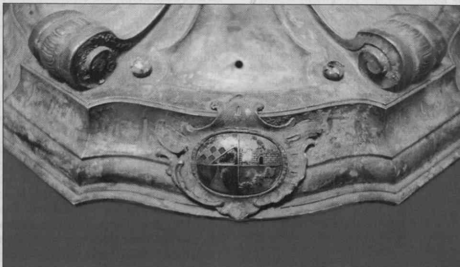
Kartuša z grbi, stanje iz leta 1998.