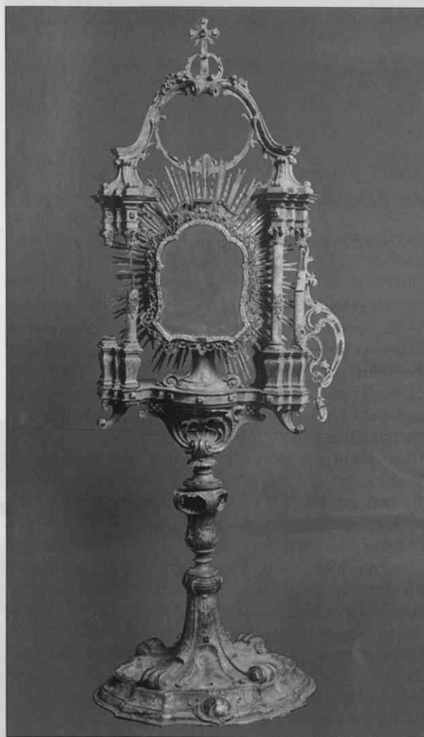
Monštranca, delo srebrarske in zlatarske delavnice "F. Harrach & Sohn" iz Münchna, 1908, Cistercijanska opatija Stična, stanje iz leta 1998.

"F. Harrach & Sohn K. B. Hof-Silberarbeiter & Ciseleur Atelier & Werkstätten Kirchlicher Goldschmiedekunst" iz Münchna pismo, ki se v prostem prevodu glasi: