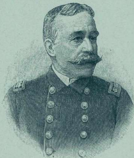
Kommodore George Dewey, poveljnik ameriškega brodogja, zmagovalec pri Manili.

Palackega slavnost v Pragi. Sredi minulega meseca so praznovali Čehi z ve-