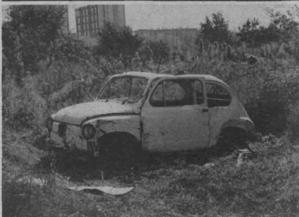
Prizori kot je tale, resnično niso v okras urejeni okolici. Pa vendar v Herberstejnovi ulici že nekaj časa semeva oplenjeni fičko. Za vpludnega lastnika, ki je odnesel registrske tablice, zaenkrat še ne vemo. Tistim, ki jim grede takšni prizori na živce, in takih je veliko, naj v toležbo povemo, da je mestna skupščina že izdala osnutek odloka o ravnanju z opuščeniimi motornimi vozili. Dokument med drugim zavezuje fizične in pravne osebe, da razbitno odpelejo do organizacij združenega dela, ki se ukvarjajo z odkupom odpadnih materialov. V nasprotju primeru je pooblaščen uradna oseba dolžna odrediti postopek, po katerem na stroške lastnika dotrajano motorno vozilo odpelejo, kršilca pa zadene denarna kazen 5000 dinarjev. Tisti, ki se tolažijo, da so z odvzemom registrskih tablic za seboj zabrisali vse sledi, se hudo motijo. Avtomobil in lastnika je vedno mogoče identificirati.