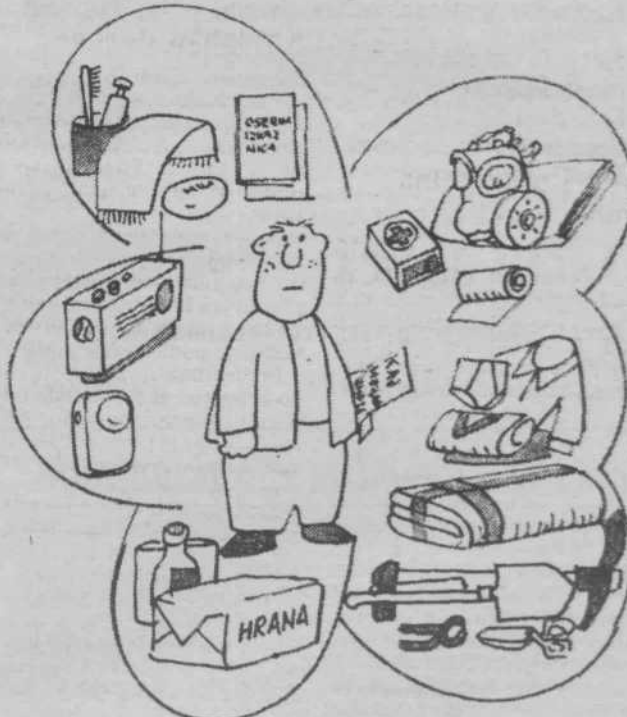
Zaščitna sredstva so najnujnejše, kar imejmo vselej pri roki.

Na vidna mesta v obratih in upravni zgradbi je treba izobesiti navodila o ravnanju delavcev v primeru zračnega alarma, ob napadu iz zraka in po njem. Če delovna organizacija upravlja z javnim lokalom ali drugimi prostori, v katerih se zbirajo ali zadržujejo ljudje, mora tudi v njih izobesiti kratka navodila o tem.