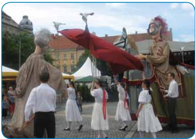
Sveti Martin prejkda kaudiši pau svojoga köpeneka

najzmetnejši časaj Martina. Kisnej smo leko na odri vidli misterijsko igro o svetnikovom žitki, septembra pa so v Galeriji oprli likovno razstavo na temo dühovnosti panonskoga svetnika.