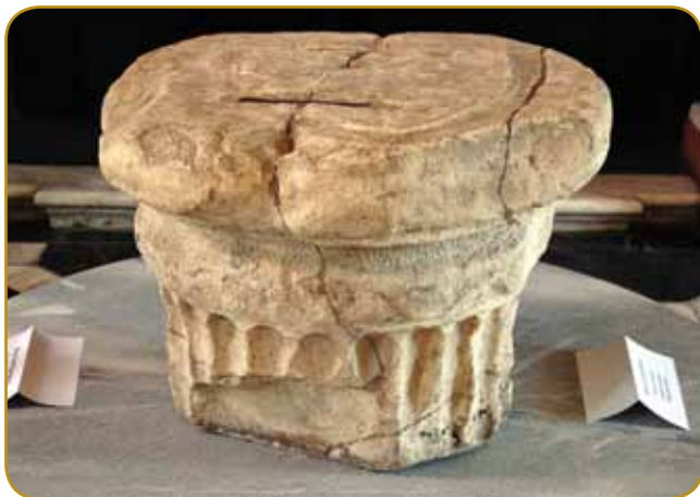
Kneži kamen je spaudnji tau rimskoga sojá, simbol moči staroga slavskoga rosaga Karantanije

Što smo Slovenci? Od kec smo prišli? Zakoj djenau na tau zemlau? - tau so pitanja, štera so dugo-du-go krauzila v glavej slovenski čednjakov indašnji cajtov. Istina je, ka o slovenskom narodi žmetno gučimo pred 19. stoletjom, eške ime »Slovenci« je protestantski predgar Primož Trubar samo pred malo več kak štirimi stoletji na paper dojspiso. Če rejsan ništerni pravijo, ka smo na svojoj zemlej od vöka vökov, vekši tau zgodovinarov je gvüšen, ka so stari starci našoga naroda v gnešnje krajino prišli v drugom tali 6. stoletja.