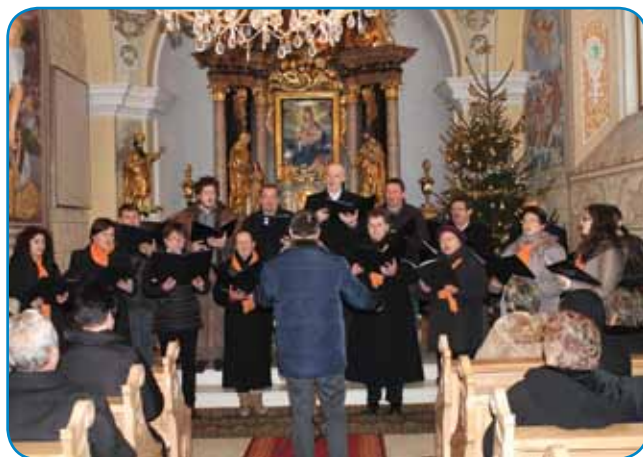
Koncerta se vsako leto udeleži tudi Mešani pevski zbor Avgust Pavel z Gornjega Senika.