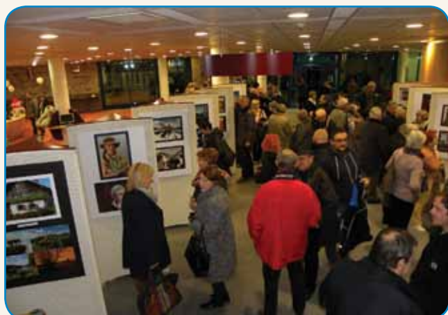
Večni popotnik... stran 4