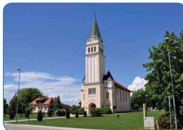
Evangeličanska cerkev v Moravski Toplicaj

so mislili, ka je senior nikši starejši človek. Iz same reči je tö nej bilou jasno