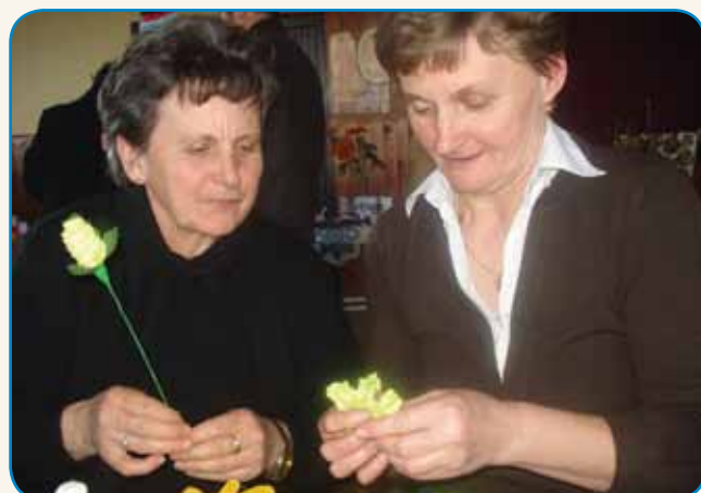
Če bi leko... stran 8