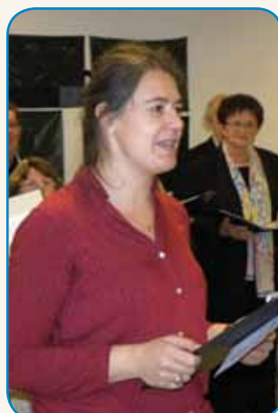
Štajerski Slovenci v Avstriji stran 6