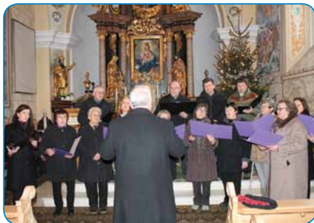
Letos so koncert gostili v župniji Dolenci. Kot prvi so se s pesmima Prišla je noč in Pastirci kam hitite predstavili domačini.