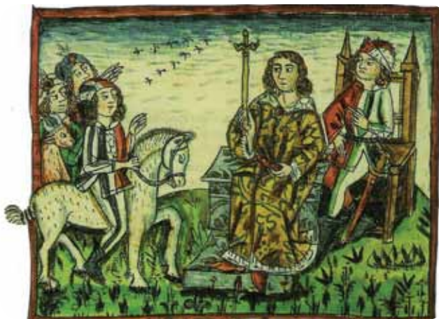
Koroškoga vojvoda so do 1414 na mesto postavljali po karantanskoi slavskoj ceremoniji

Ta ceremonija se je gordržala do leta 1414. Kneži kamen je gnes v Celovci (Klagenfurt) v dvorani deželnoga zbora, najdemo ga pa na slovenski 2