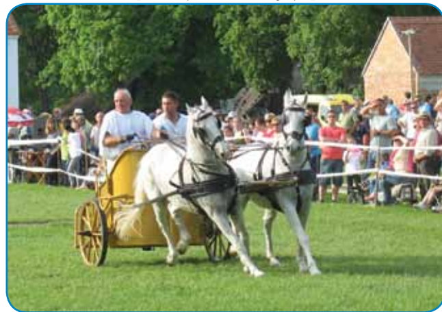
Rimske kaule na Martinovom tekmovanji v Škanzeni

V programaj »Po Martinovoj pauti« je bilau glavno padašvo Sombotela z drugimi varaši z Martinovim kultom. Med programi smo leko čüli pripovejdanja o evropskoj kulturnoj pauti ali o tom, kak vsi narodi malo po svojom