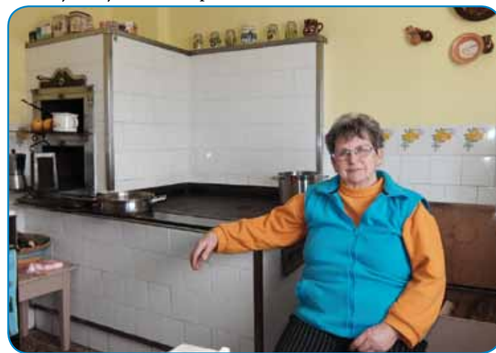
Šumistji Iluš pred značilnim špajetom, steri se tak svejti, ka bi si ešče müja nogau strla na njem

»Tau je tisti, pa zato je drži, ka mlejko štje odavati, pa