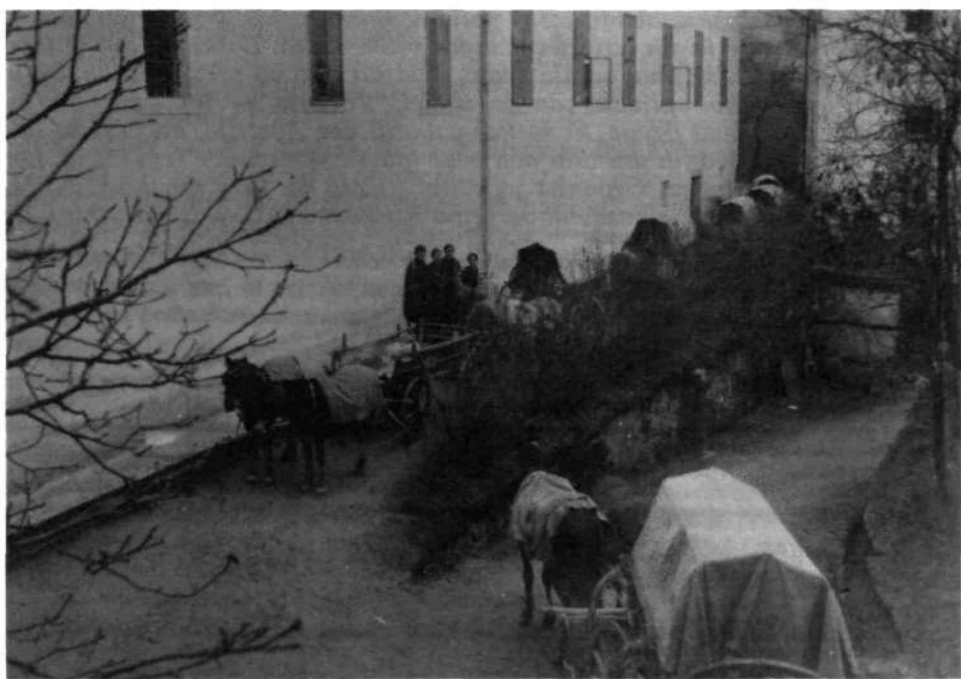
Prihod kolone vojaških voz z moko pred uršulinski samostan v Škofji Loki novembra 1915

19. X. sem naprosil beguna Rusina Mijehkiga, da bi tu maševal in