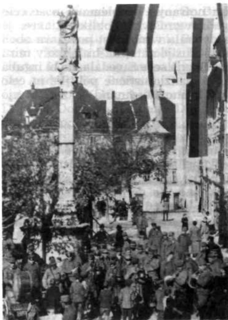
Avstroogrška vojaška godba leta 1917 na Mestnem trgu

V občini Sora so regulirali reko Soro. Pri tem je veliko dela opravil – posebno po izbruhu vojne – tamkajšnji župnik Finžgar. V Gabrku v občini Zminec so nameravali zidati šolo. Poleg tega so se v vojnem letu kar v treh župnijah odločili za popravilo cerkve ali za zidavo: v Stražišču (Šmartin) so cerkev temeljito obnovili znotraj in zunaj, v Retečah so dozidali kapelico, v Sorici pa popravljali župnišče. Tik pred vojno je dobila cerkev v Žireh nova zvonova. Nakup novih orgel je preprečila vojna.