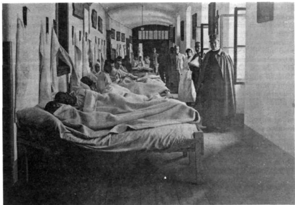
Med 1. svetovno vojno je bila na Loškem gradu vojaška bolnišnica avstroogrške vojske

prebiranja 2. 12. v Loki, potrjeni vojaki morajo hitro odriniti pod orožje. (Sorica)