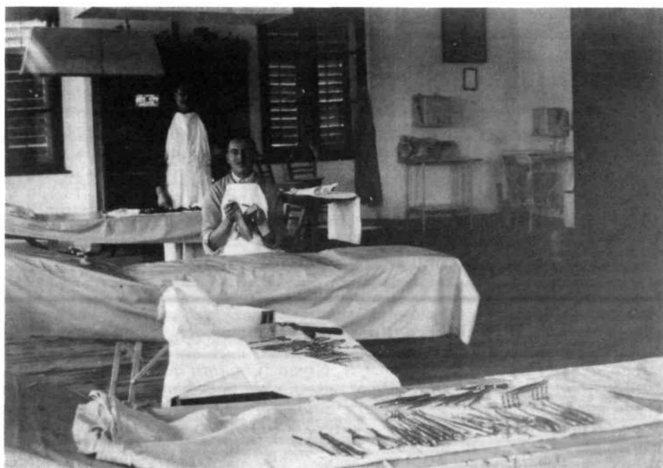
Operacijska soba v bolnišnici na Loškem gradu

Zakon iz leta 1912 določa državno preskrbnino svojcem vpoklicanih v vojsko: staršem, otrokom, bratom, sestram, če jih je vpoklicani v mirnem času podpiral. Prošnje se vlagajo pri županstvu. Podpore so bile precejšnje, toda denar je padal. Duhovščina je imela s temi prošnjami veliko dela, ker tajnika občina ni imela, župan pa je bil star in nesposoben. Tudi prošnje za