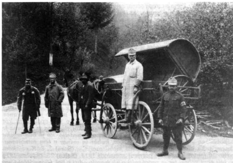
Razkuževalni vojaški voz med 1. svetovno vojno za razkuževanje oblačil, povojev ipd.

III. bojni kor 6 s slovenskimi polki se je odpeljal v Galicijo na rusko mejo, mlajši črnovojniki so odšli v Bosno nad Srba, starejši pa so zastražili železniške proge. 21. avgusta je bila velika bitka okoli Levova. 7 Sovražna