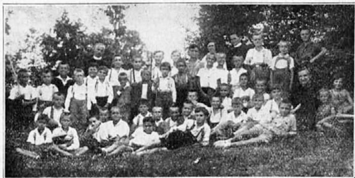
Skupina navdušenih ljubljanskih »Lučkarjev« na Magdalenski gori.