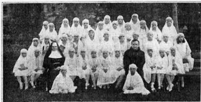
Skupina sestic sv. Klare iz Maribora.