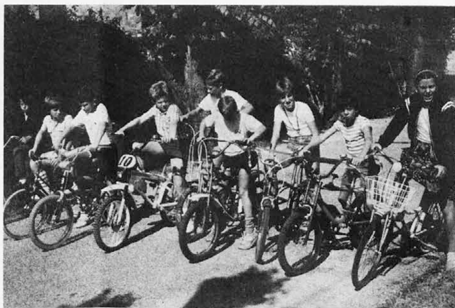
V Nabrežini imamo že osmo leto med počitnicami vsako sredo ob 9. uri sv. mašo s petjem, govorom, nakar sledijo različne igre na vrtu ali v drevoredu (kolesarjenje), vedno z nagradami, kar je združeno z vikom in smehom

Pohvalo zasluži tudi SD Sovodnje, ki je vsaki večer, pa naj si bo ob še tako pozni uri, poskrbelo, da so atleti in spremlje-