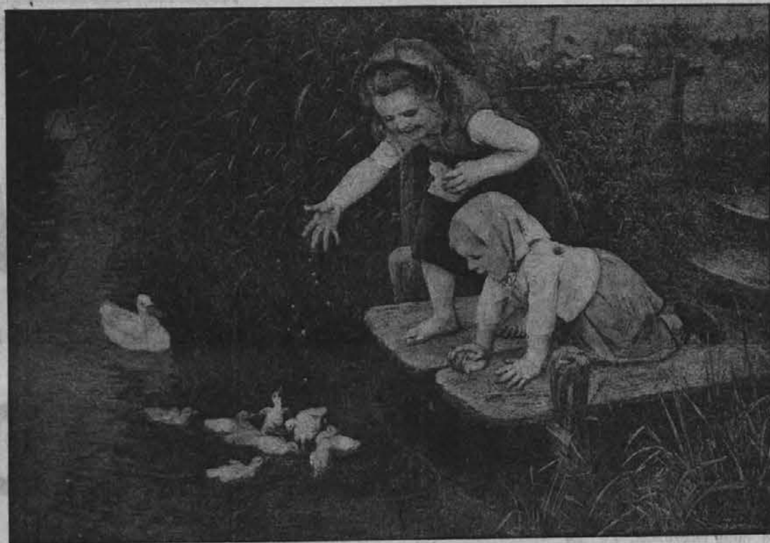
Nedolžni deklici krmita race

Mladinski kotiček je bil pri vseh otrocih lepo sprejet. In še vedno nam prihajajo nove zahvale. Otrokom bi ugajalo več slik. Tudi od starišev smo dobili pohvalo za trud. Kakor otroci, tako tudi stariši in drugi, zahtevajo slik. Nihče pa ne pomisli, koliko stanejo slike. To je zelo draga zadeva. Zato se obračamo do vseh dobrih sre, naj kaj prispevajo za slike k Mladinskemu kotičku. Za vsak najmanjši dar bo Kotičkovo uredništvo zelo hvaležno. Pošlje se lahko tudi v znamkah na Uredništvo Slovenskega lista, ali na naslov: Kotičkovo uredništvo, C. C. 171. Buenos Aires. Imamo namreč prav lepih povestice, ki bodo ugajale tudi odraslim. Brez slik bi pa te povestice ne bile popolne, zato jih nemoremo začeti priobčevati. Na delo torej za našo mladino.