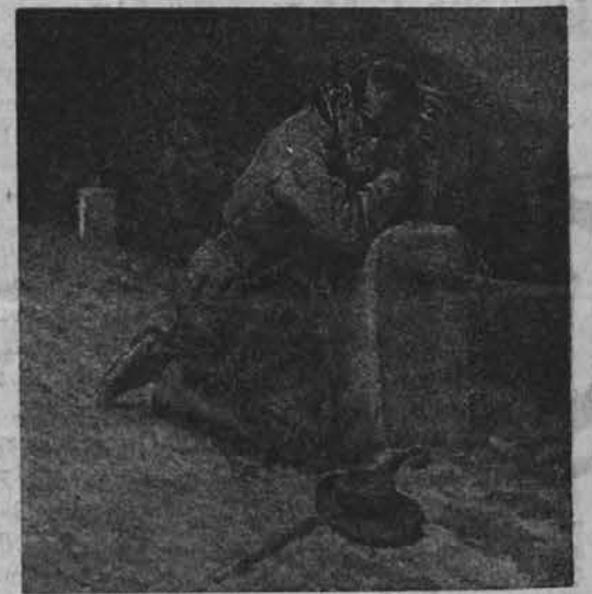
Prispodoba k zgornji sliki