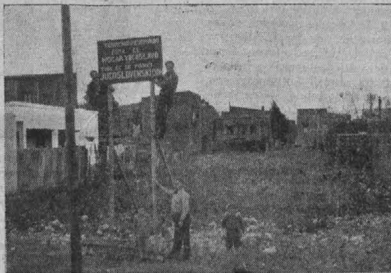
Na praznem zemljišču, ki ga vidimo na sliki, bo stal Jugoslovanski dom na Dock Sudu