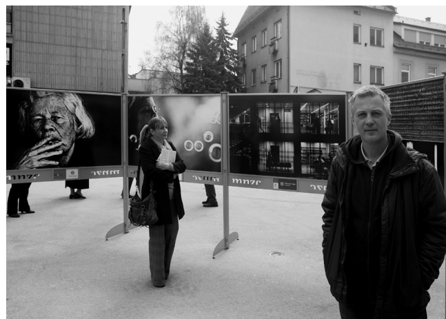
Celje, Trg celjskih knezov, 14. 4. 2010