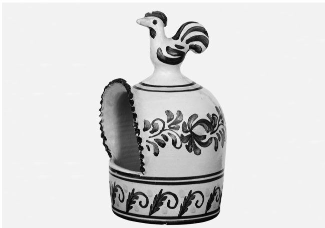
Solnica; izdelek Adolfa Hašaja.

Foto: Tomislav Vrečič, Murska Sobota, junij 2009