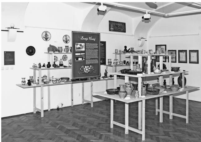
Razstavljeni lončarski izdelki v razstavišču Pokrajinskega muzeja Murska Sobota.