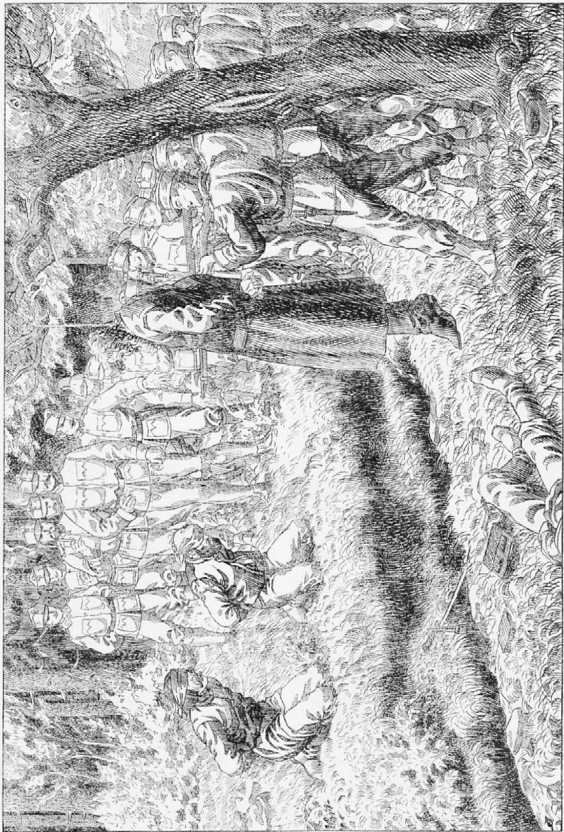
Kazen za špione.