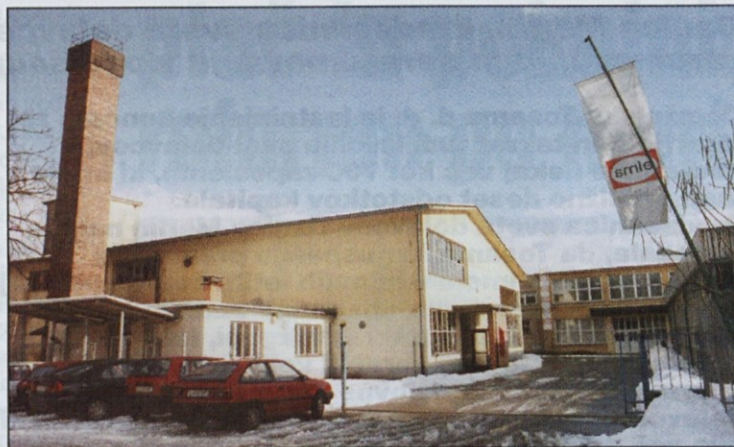
Pred Elmo še vedno vihra zastava