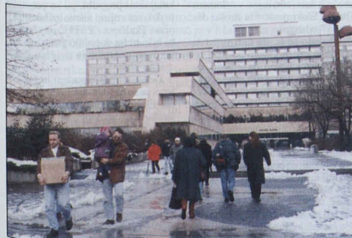
Bo reorganizacija zdravstva, ki so jo prvič napovedali v Kliničnem centru v Ljubljani, spremenila tudi življenje pred to največjo zdravstveno ustanovo?