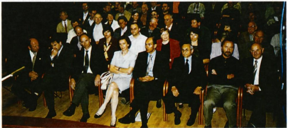
Gostje in gostitelji javne tribune Koalicije Slovenija.

Prepričana je, da je v politiko treba pritegniti ljudi, ki imajo občutek za skupnost in bi želeli kaj prispevati. Menila je, da imamo veliko talentov, da je treba dati prostor pomembnim