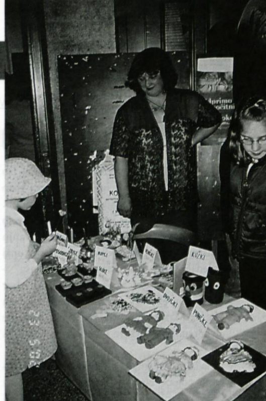
Nekateri lični in uporabni izdelki žal niso bili prodani.