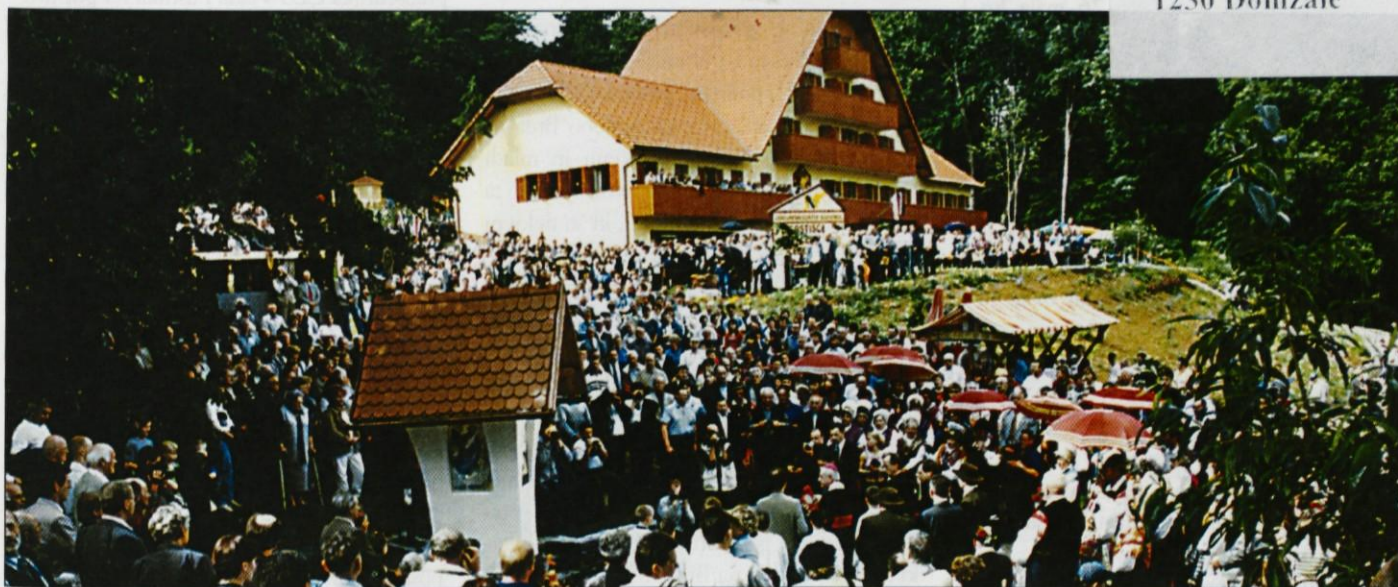
Ob odprtju Čebelarkega centra Slovenije in blagoslovu kapelice na Brdu.