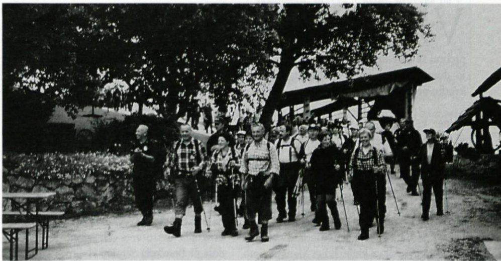
Veseli in zadovoljni udeleženci.

Prvega junija zvečer ob pol devetih (zakaj zvečer in zakaj ponoči - no, saj veste, rokovnjači so delovali ponoči) so pohodniki krenili iz Trojan preko Špilka. Mimogrede, tam jih je ujela nevihta, ki k sreči ni trajala dolgo. Pot so nadaljevali do Češnjic nad Blagovico in popili vroč čaj, odhiteli proti Vrh nad