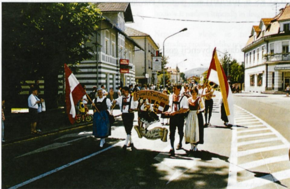
Ob 14. uri se je v Domžalah pričela povorka.