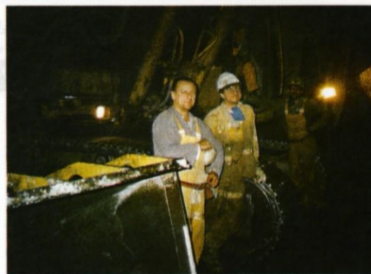
Slovaški delavci so v predoru Trojanje le za kratek čas lahko ustavili delo.

Predstavnik iz Blagovice je tudi zanimalo ali