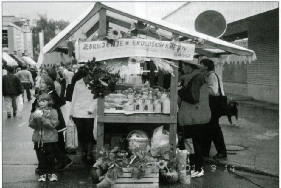
Prodaja ekoloških pridelkov Združenja ekoloških kmetov "Zdravo življenje" na eni od sejmskih privedev v Domžalah.

Ugotovili smo, da so anketirane kmetije pretežno hribovsko-višinske, zato se že zaradi naravnih danosti ne morejo ukvarjati s kakršnokoli intenzivno rejo ali pridelavo. Usmerjene so v živinorejo (94%). 13% je čistih kmetij, kar pomeni, da je kmetija edini vir dohodka. Po velikosti in sestavi zemljišč