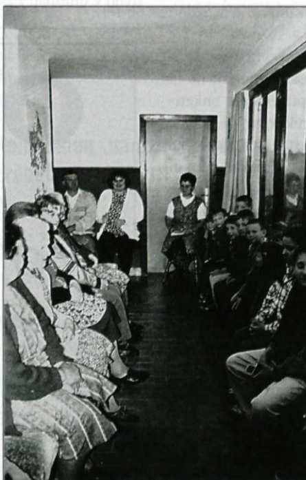
Pri Brgantovih v Dupelnjah berejo šmarnice že od 1938. leta.