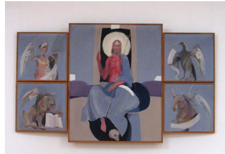
Lucijan Bratuš, Kristus Kralj, platno, olje, kompozicija 300 cm x 180 cm, 1979.

Križna kompozicija centralne slike Kristusa kralja je še potencirana z bočno postavljenimi liki štirih evangelistov.