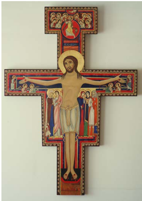
Albina Nastran, replika Damijanovega križa, ikonopis, vezana plošča, olje, tempera, zlato, 118 cm x 86 cm, 2011.

Originalni tabelni križ predstavlja veliko, dvometrsko bizantinsko ikono, ki simbolizira Kristusa kot »Alfo« in »Omega«, središče zgodovine. Kristus je po tedanji tradiciji uprizorjen kot zmagovalec nad smrtjo in grehom. Glavo mu obdaja zlat nimb, krona - križ Odrešenika, ki z odprtimi očmi priča o svojem vstajenju. Bogata ikonografija križa, na ikoni je kar 33 figur, temelji na Janezovem evangeliju, je rodila številne izvedenke v srednji Italiji in tudi drugod po sredozemskem prostoru. Nekaj jih poznamo tudi iz dalmatinskih cerkva.