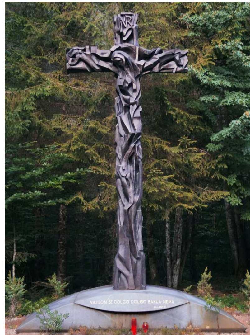
Metod Frlic, Križ, bron, 2005, (original, les 1986), 250 cm x 546 cm x 73 cm. Foto: Metod Frlic

Metod Frlic, kipar in slikar, je likovni ustvarjalec širokega spektra. Ustvarja v kamnu in lesu ter rad eksperimentira z drugimi umetniškimi tehnikami, pogosto z vsebinsko radikalnimi sporočili. Je družbeno likovno kritičen, zaradi nasilja, krivic, izkoriščanja, kršitev človekovih pravic in drugih grehov posameznikov ali velikih sistemov tudi provokativen. Za svoja dela je dobil več pomembnih pri-