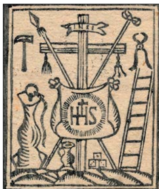
Podobica križa brez Kristusa

maziljenje, možnja s V baroku se iz štirinajstih vije klasični Križev pot, škem sta iz baročne dobe Eden je stal pred vhodom jinega oznanjenja v Crndi loškega kapucinskega sv. Ane. Slednji je tam stal vojne. Prav bi bilo, da sorazpelo z ikonografijo svoj prostor na istem