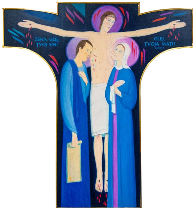
Lojze Čemažar, Križ, olje na platnu (lesna podlaga), 90 cm x 100 cm, 1996.

Slika Križ je bila narejena za darilo svetemu očetu Janezu Pavlu II., ko nas je prvič obiskal. V premišljevanju Jezusovih besed s križa, izrečenih svoji materi in učencu, se nam odkriva tudi lepota daru služenja sv. papeža Janeza Pavla II. Bogu, sveti Cerkvi in človeštvu pod Marijinim varstvom. V tem se kaže tudi resničnost gesla njegovega pontifikata, »ves Tvoj«. Podoba mu je bila izročena v letu papeževega zlatomašnega jubileja na njegov rojstni dan, 18. maja 1996, na srečanju z njim v Stožicah pri Ljubljani.