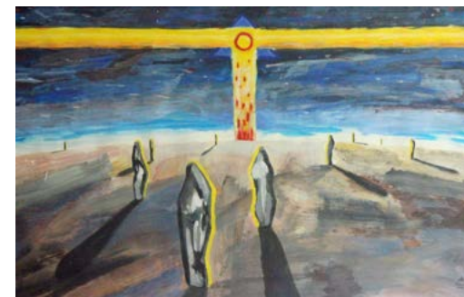
Začetna verzija slike Vstali Jezus Kristus, gvaš, 100 cm x 65 cm, 1998.