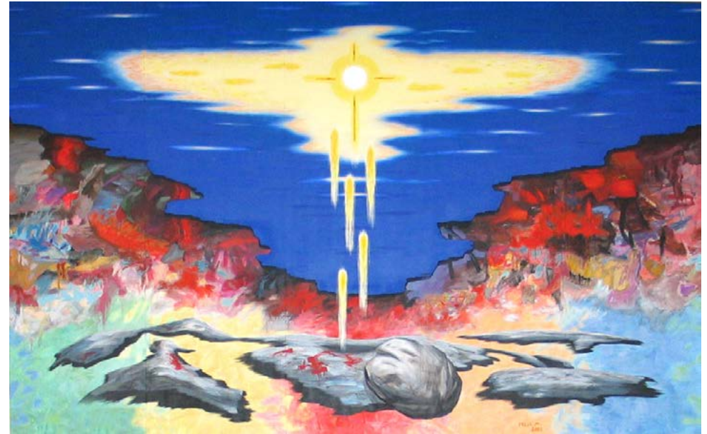
Slika Vstali Jezus Kristus, velika je 670 cm x 450 cm in v velikonočnem času visi nad glavnim oltarjem – med velikonočno soboto od velikonočne vigilije, večera pred praznikom Velike noči do binkoštnega ponedeljka.