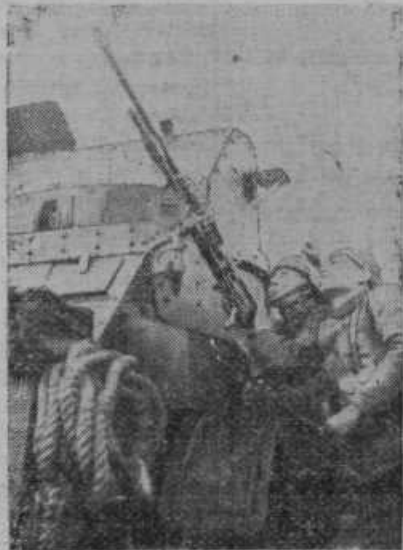
Posadka francoskega tanka namerja strojnico proti letalom

Poglararica ruskih brezbožnic. To mesto je zdaj zavzela gospa Molotov, soproga predsednika ljudskih komisarjev (ministrskega predsednika) in zunanjega ministra. Ob priliki, ko je stopila na čelo ruskih brezbožnic, je gospa Molotov izjavila: »Najvažnejša naloga sovjetske države in komunistične stranke je pobijanje vpliva religije na žene. Cerkev mora popolnoma izginiti iz življenja žensk; zakaj resnična Rusinja ne more sprejeti Stalinovih ukazov, če ni stoodstotna brezbožnica. Na-