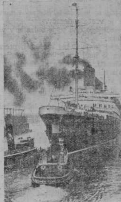
Največja nemška potniška ladja »Bremen«, o kateri ugiba ves svet, v katero nepristransko luko bi se naj bila zatekla na povratku iz Njujorka v Hamburg