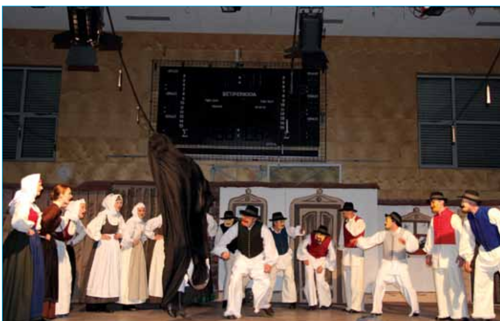
Pevci ljudskih pesmi - orači