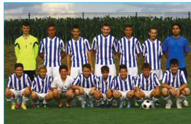
U 14 Bukovci