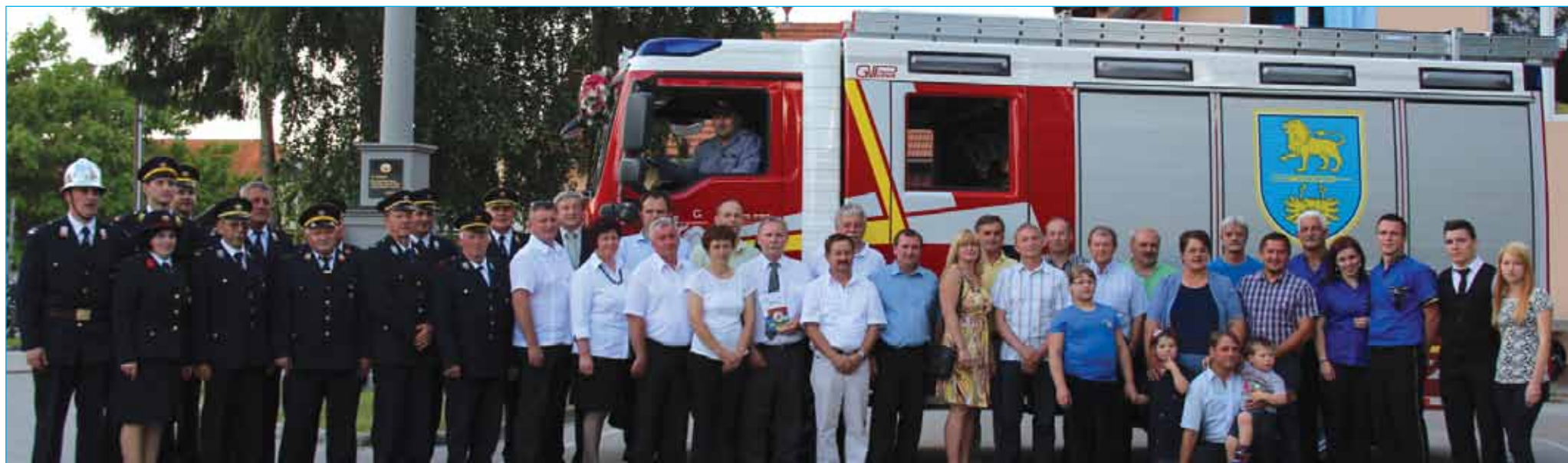
Skupinska slika vodstva PGD Stojnci, OGZ Ptuj in poveljstva Markovci z botri novega vozila