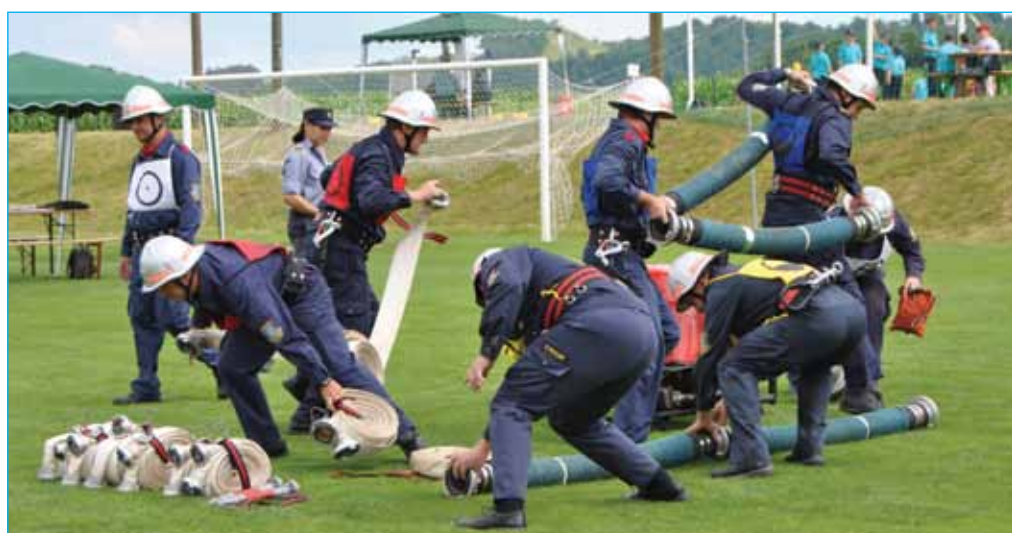
Vaja z vedrovko (na fotografiji pionirke PGD Bukovci)