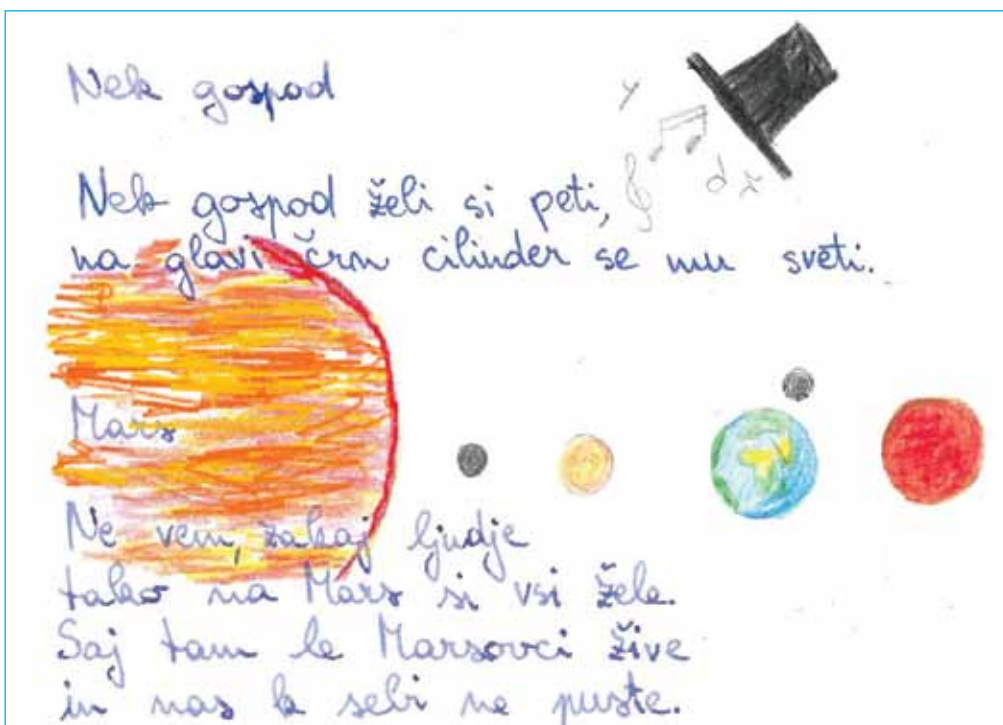
Avtorica pesmi je Špela Vrtačnik.