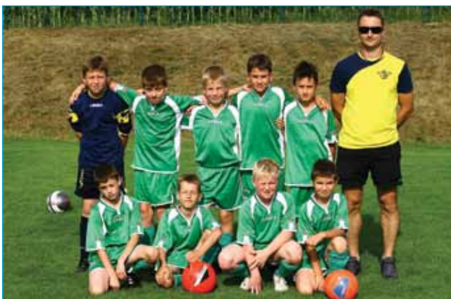
U 10 Stojnci