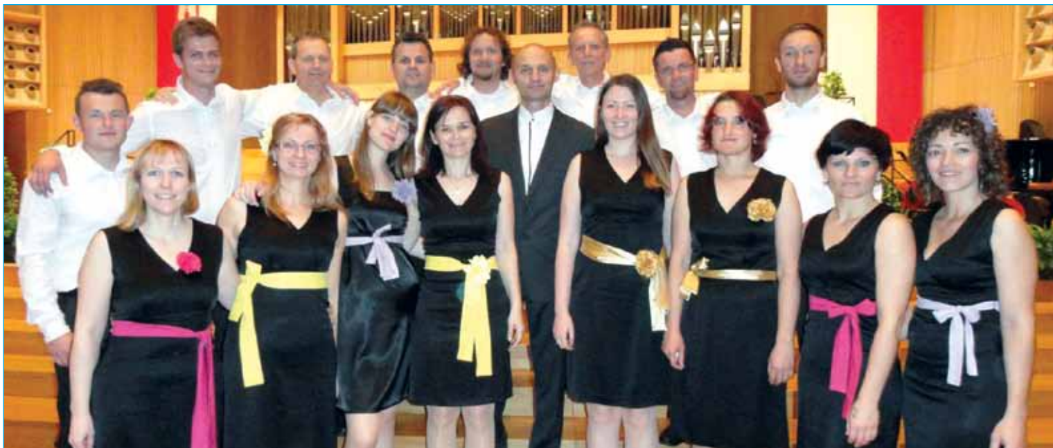
Komorni zbor Kor takoj po tekmovalnem nastopu v čudoviti dvorani kulturnega centra Brucknerhaus

Ob koncu naj poudarim, da zelo cenimo podporo Občine Markovci in ostalih sponzorjev, ki nam omogočajo delovanje in tovrstna sodelovanja.