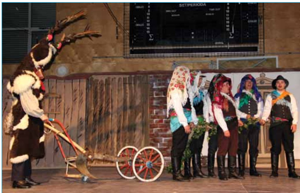
Pevci ljudskih pesmi: »Prijatelj moj, nič se ne ženi.«