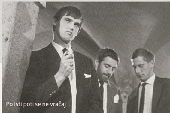
Po isti poti se ne vračaj