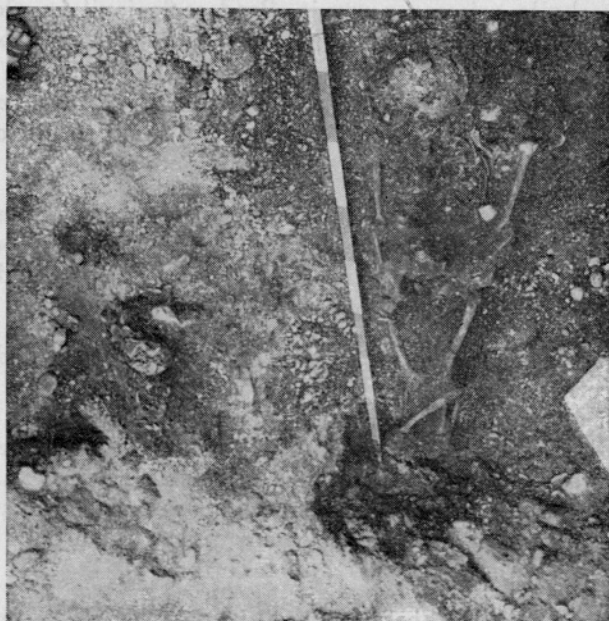
Sl. 2. Drulovka, grob 2 Fig. 2. Drulovka, tombe 2