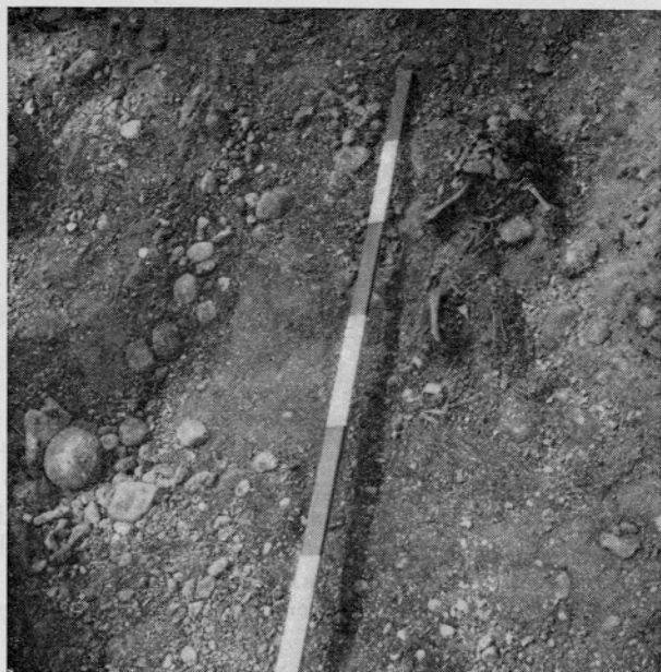
Sl. 1. Drulovka, grob 1 Fig. 1. Drulovka, tombe 1