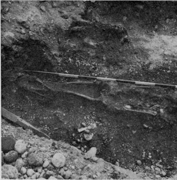
Sl. 4. Drulovka, grob 5

Neki drug fragment sivočrno žganega lonca izredno grobe fature ima vrezano valovnico. Po fragmentu sodeč je bil lonec samo dodelan na lončarskem kolesu. Ohranjena višina fragmenta 3,4 cm (T. 1: 2).