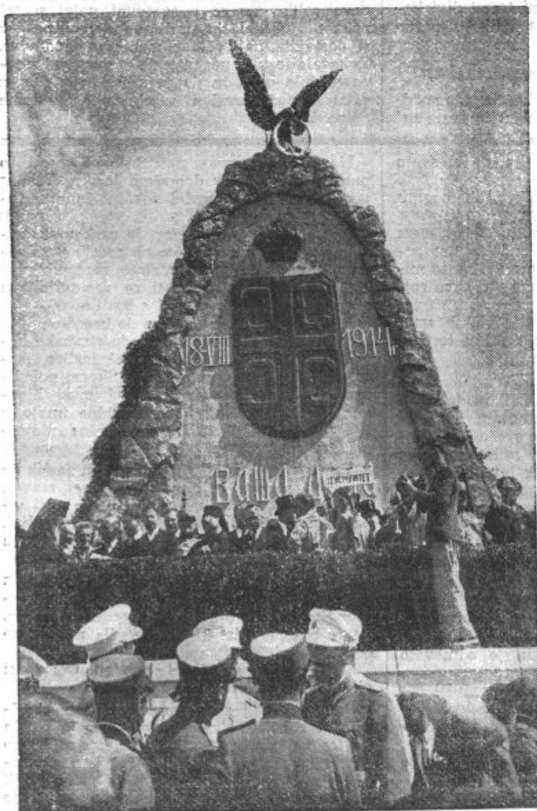
Pred spomenikom na Ceru ob spominskem slavlju v soboto

Avstrijska ofenziva se je začela 12. avgusta l. 1914. V močnih oddelkih je začela avstrijska vojska prehajati čez Drino, a v ne-