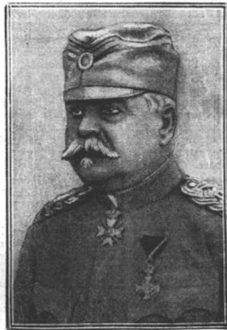
Zmagoslavni vojvoda Stepa Stepanović

V nastopnem naj v kratkih obrisih podamo potek bitke na Ceru: