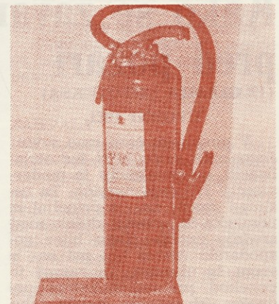
Ročni gasilski aparat »S« na prah

V tej skupini so les, lesonit, pluta, papir, blago, naravna in umetna vlakna, koža, guma, celuloz, premog, seno, slama, plastične mase, ki zgorevajo s plamenom in žarenjem (tlenjem). Gorenje se začne z učinkovanjem zunanjega toplotnega vira.