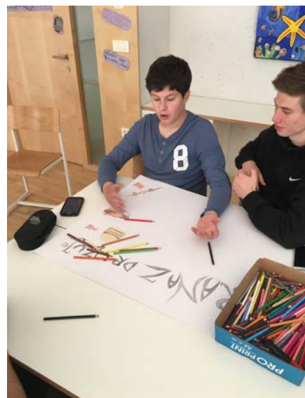
Slika 7: Risanje na plakat

Zanimiva je bila ugotovitev, da tudi hrana združuje. To smo poimenovali »multikulinaričnost«, saj imamo vsi radi čevapčiče, burek, kebab, kitajsko hrano, suši ... Dijak, ki rad riše, je to prikazal na plakatu.