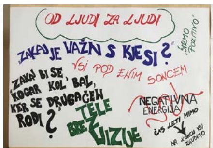
Slika 6: Plakat 3

Zasledili smo tudi misli, da »različnost bogati prihodnost«, kar smo še posebej poudarili, zato je treba »odpreti srca«, »razbiti stereotipe«, »vsi pod enim soncem«; »čas leti mimo – na koncu vsi zgubimo«, saj »taka logika je mimo«, zato »širimo pozitivno«.