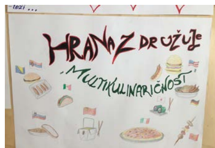
Slika 8: Plakat 4 »Multikulinaričnost«

Projektne tedni imajo tako izobraževalni kot vzgojni pomen, zato so še kako pomembni. Še posebej, če je tema takšna, kot je bila ta – medkulturni dialog. Spoznala sem, da je dobro vplivalo na to projektne skupino, da smo govorili o tej problematiki, ker imajo v razredu avtista, ki je drugačen od njih. Začeli so razmišljati drugače. Na splošno so take teme, ki zajemajo splošne družbene probleme, dobra popotnica mladim za naprej.