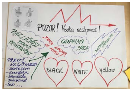
Slika 5: Plakat 2

motivirani v vseh fazah dela. Uporabiti je treba različne metode dela, multimedijška sredstva,