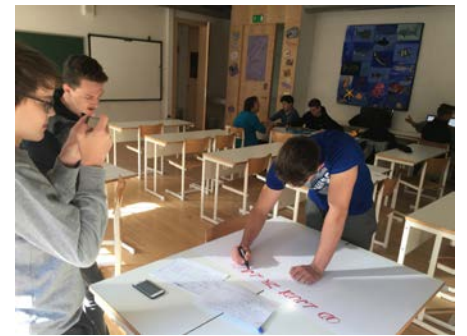
Slika 3: Izdelava plakatov