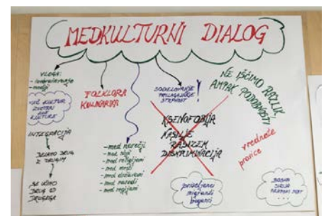
Slika 4: Plakat 1