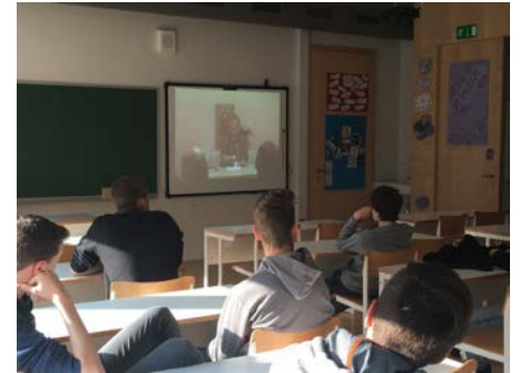
Slika 2: Ogled oddaje o medkulturnosti