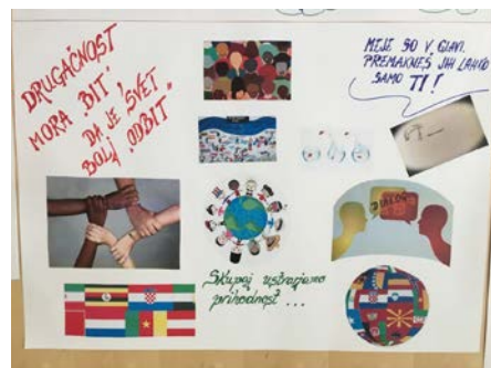
Slika 9: Plakat 5

Projektne tedni imajo tako izobraževalni kot vzgojni pomen, zato so še kako pomembni. Še posebej, če je tema takšna, kot je bila ta – medkulturni dialog. Spoznala sem, da je dobro vplivalo na to projektne skupino, da smo govorili o tej problematiki, ker imajo v razredu avtista, ki je drugačen od njih. Začeli so razmišljati drugače. Na splošno so take teme, ki zajemajo splošne družbene probleme, dobra popotnica mladim za naprej.