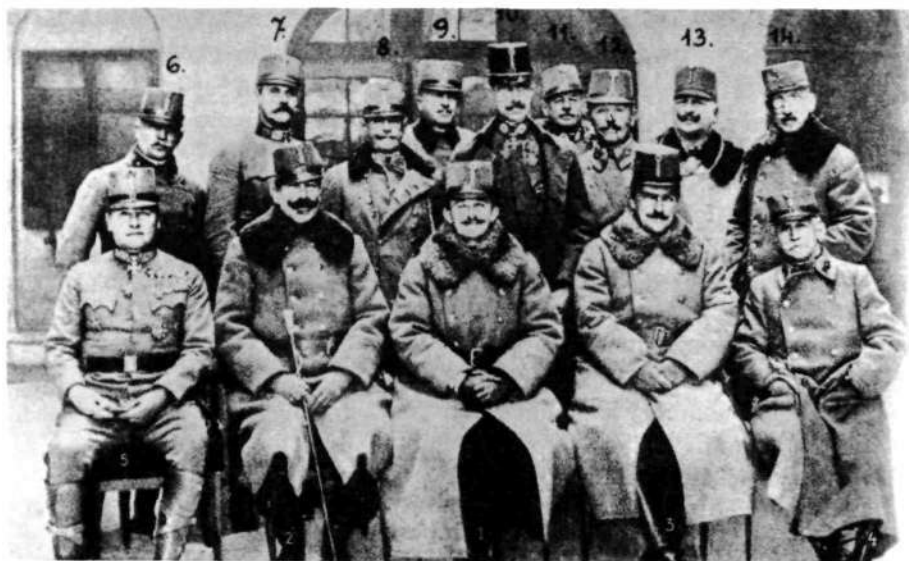
Cesar Karel I. in najvišji komandanti Austro-Ogrske vojske

Opremo imajo izborno. Pešci nosijo na nizkih kapah – podobnih krožnikom, rdeč pas, ki je v vojski zakrit z belim trakom, ženijske 14 čete in topništvo ima črn pas, konjeniki