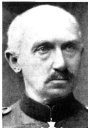
General Otto von Below