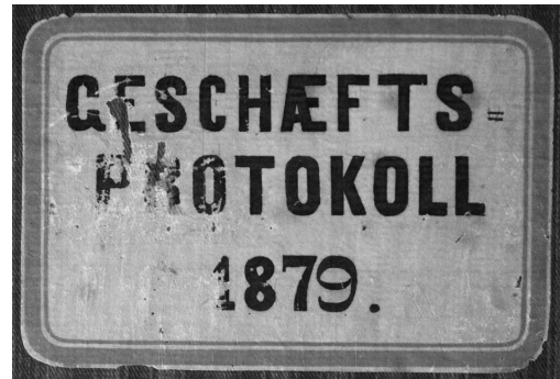
Slika 2: Naslovna stran poslovnega protokola mariborskih oblasti 189