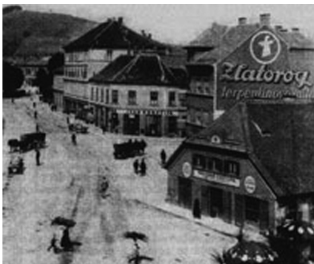
Slika 4: Teslova kvartopirska gostilna pri Veselem kmetu v Mariboru

med Čehi, Avstrijci in Slovenci, vprašanje pa je, koliko je zašel v Karlovac ali celo med Ličane.