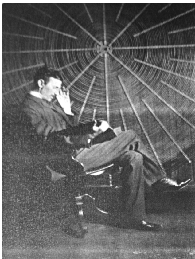
Slika 10: Tesla bere Boškovićevo Teorijo v New Yorku pred svojim laboratorijskim spiralnim sekundarnim navitjem visokofrekvenčnega transformatorja.

Seveda pa je bil obstoj obeh nasprotujočih si sil v molekuli po objavi R. Clausiusovega virialnega teorema leta 1870 že dokaj nedvomen, čeprav sta npr.