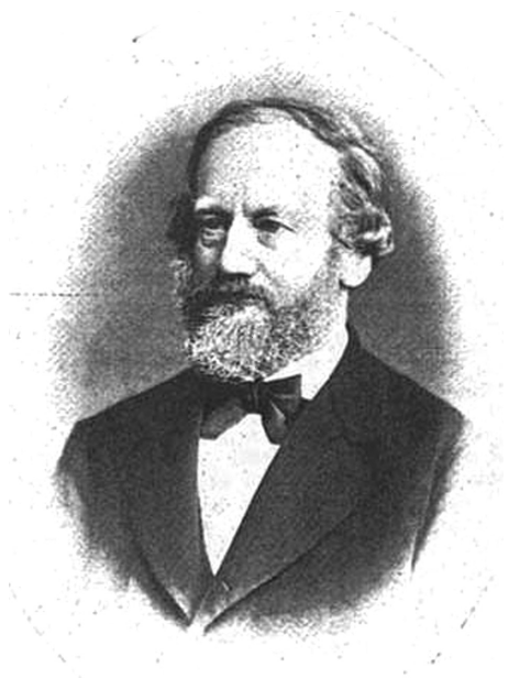
Slika 9: Teslov praški profesor matematike Heinrich Durege

Heinrich Durege (Durège, * 1821; † 1893) je prišel v Prago leta 1864 iz Züricha; najprej na politehniški institut in nato leta 1869 na univerzo. V zimskem semestru 1879/80 je Durège predaval Diferencialni in integralni račun, krivulje v prostoru, krive ploskve in matematične vaje. V poletnem semestru 1880 je predsedal na drugo stopnjo Diferencialnega in integralnega računa, obenem pa je predaval še Analitično geometriji prostora, ki naj bi jo poslušal Tesla po dve uri na teden.