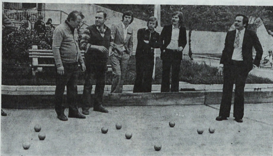
Balinarji: katera krogla je bliže »balincu«?

Kljub primerni udeležbi moramo poudariti, da bi gotovo sodelovalo v športnih igrah še več ljudi, če bi bilo vreme bolj toplo in sončno. Upamo, da bodo tudi bodoče športne prireditve tako in še bolj uspešne.