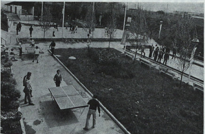
Pogled na športno dogajanje s terase nad jedilnico