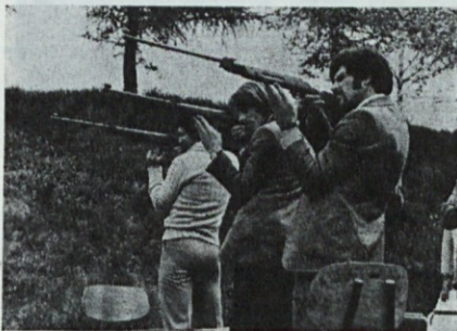
Strelci: kdo bo boljši?