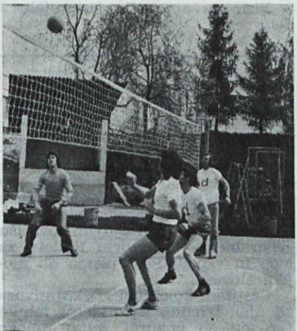
Odbojkarji v akciji